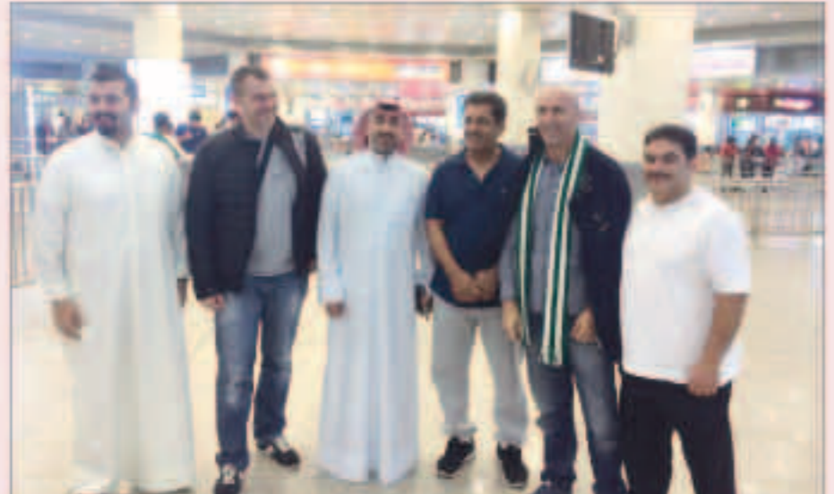
ميودراج أثناء وصوله للمطار

وصل مدرب العربي الكويتي الجديد الصربي ميودراج جيست إلى الكويت في ساعة مبكرة من فجر أمس، استعدادا لبداية مهمته مع الأخضر الكويتي، خلفا للمدرب المال فوزي إبراهيم. ومن المقرر أن يباشر ميودراج مهامه الفعلية مع الأخضر عقب مباراة الفريق المقبلة أمام الكويت، والمقررة في الجولة السادسة من الدوري، حيث سيقود العربي في هذه المباراة المدرب أحمد عسكر، والذي استلم المهمة بشكل مؤقت بعد اغالة إبراهيم.