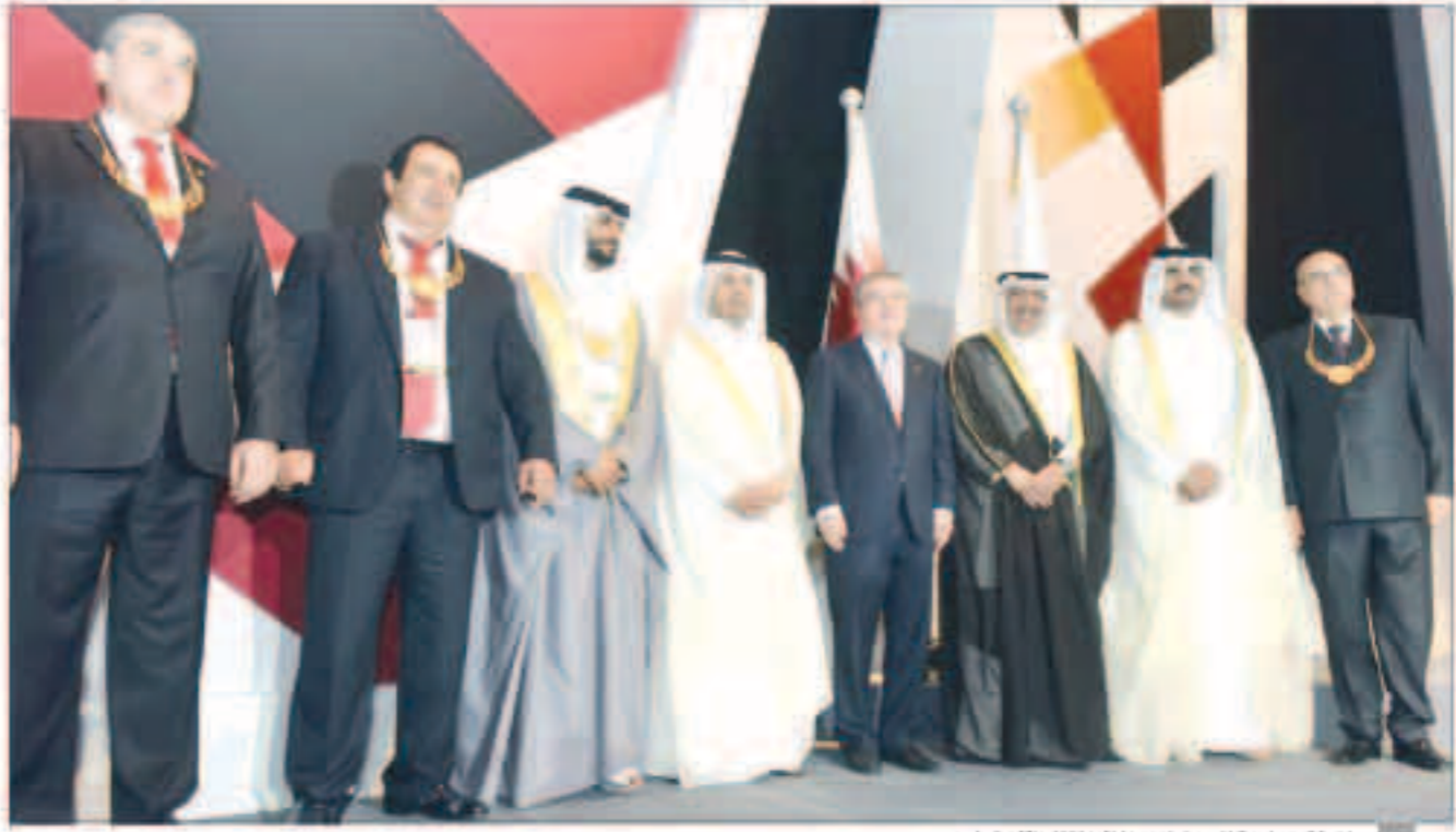
لمقابلة جماعية للمسؤولين خلال الاجتماع

استهل الاجتماع السنوي للجمعية العمومية لاتحاد اللجان الأولمبية الوطنية «أنوك»، فعاليات جلسته الأولى، أمس الثلاثاء في العاصمة القطرية الدوحة، بتكريم عدد من الشخصيات على دورها الفعال، والمهم في تطوير وإنشاء الحركة الرياضية، والأولمبية في بلدانهم والعالم.