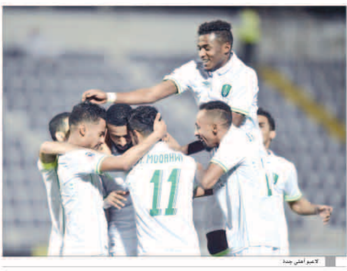
لاعب أهلي جدة

أكد برانكو إيفانكوفيتش، مدرب أهلي جدة، أنه ينطلق للفوز بلقب دوري أبطال آسيا مع فريقه، لافتاً إلى أن الأهلي يضم مجموعة جيدة من اللاعبين ينقدّمهم المهاجم ديجانيني، وأبدي رضاه من تعاقدات مجلس الإدارة. وقال المدرب الكرواتي بحسب العربية، «أنا سعيد لأن النادي يملك طموحاً كبيراً، ولدينا تحدّي لا يمكن تجاهله، حيث إن مباراتنا الأولى ستكون مع الهلال في ذهاب دور الـ 16 من دوري أبطال آسيا، وستفعل ما يوسعنا للفوز، لأننا نطمح للفوز بلقب دوري الأبطال». وأضاف المدرب الذي تعاقد مع الأهلي لمدة موسمين: أعرف نادي الأهلي جيداً، ليس فقط منذ أشهر قليلة، أعرفه منذ أكثر من ثمانين سنوات مضت.. عندما كنت مدرباً للهلال، هو واحد من الفرق الأربعة الكبيرة الموجودة في السعودية إلى جانب الاتحاد والنصر والهلال. وكشف صاحب الـ 65 عاماً عن أهدافه مع الفريق، موضحاً: بالطبع جئت إلى هنا لأحقق نتائج مرضية للجميع، وجعل الجماهير سعيدة وفخورة بفريقها، حالياً نحن مطالبون بتحقيق الألقاب والفوز بأكبر عدد من المباريات، وأشعر أن فلسفتي الكروية تنطابق كثيراً مع ما يظلمه ويسعى لتحقيقه النادي، والأهلي يمتلك طريقة خاصة في كرة القدم ولديه فلسفة كروية احترافية تحترق، كما أن إدارته تتابع جميع التفاصيل وتهتم بها. وامتدح برانكو إمكانات اللاعبين، لاسيما مهاجم الرأس الأخضر ديجانيني، وأردف: اللاعبون يملكون قدرات مهارية وبنية عالية، لدينا مخزون من الرأس الأخضر ديجانيني نفاريس وديجانيه لاعبون آخرون متميزون، وأنا سعيد بالاختيارات التي قامت بها الإدارة الأهلاوية، وسأكون الفارق منذ المباراة الأولى.