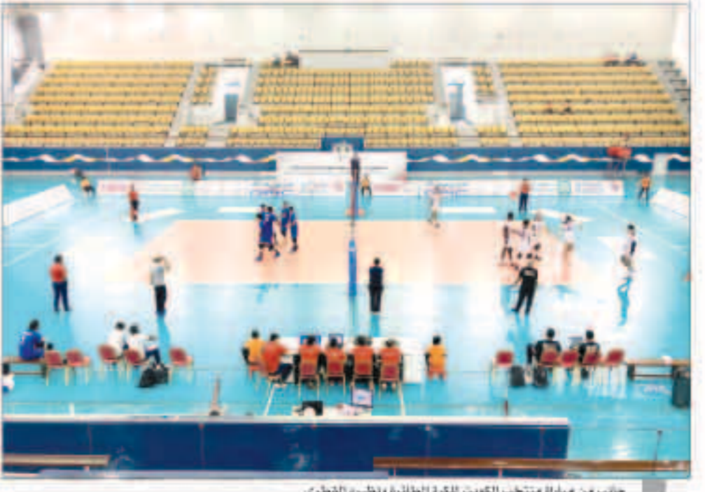
جانب من مباراة منتخب الكويت لكرة الطائرة ونظيره القطري

خسر منتخب الكويت لكرة الطائرة أمام نظيره القطري أول أمس بثلاثة أشواط مقابل شوط واحد في رابع جولات تصفيات غرب آسيا لكرة الطائرة تحت ستة المقامة حالياً في البحرين. وجاءت نتائج الأشواط على النحو التالي (25-22) لمصلحة المنتخب القطري في الشوط الأول فيما عادل منتخب الكويت النتيجة في الشوط الثاني بحصوله على (25-17) نقطة في حين حصل قطر في الشوط الثالث على (25-23). وحسم منتخب القطري نتيجة اللقاء لصالحه بتقدمه في الشوط الرابع بنتيجة 25 نقطة مقابل 19 لمنتخب الكويت. وفاز المنتخب السعودي على