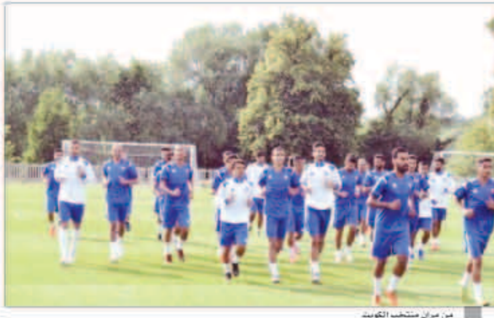
من مران منتخب الكويت

سعدية أن الجهاز الفني سيبدأ بعد ميايرة الغد في تكثيف الجرععات الخططية والتنككية بعد نجاحه في الارتقاء بمعدلات اللياقة بشكل كبير بالمرحلة الأولى. ولقت عوض إلى أن الجهاز الفني منح الفرصة لمعظم اللاعبين في أول تجربتين أمام مارلو وفييفر فور، للموقف على مدى استفادة اللاعبين من المعسكر لاسيما بالشق البدني. وتمن الجهد الكبير للجهاز الطبي بقيادة الدكتور عبد المجيد البستاني في علاج وتجهيز اللاعبين لاسيما وأن المعسكر يأتي ضمن فترة الإعداد الأولى والتي تشهد العديد من حالات الإجهاد والتقلصات العضلية.