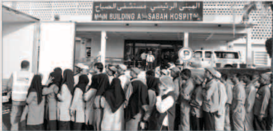
المتطوعون خلال إحدى الجولات الميدانية

يقفها البنك وإبرازها برنامج البنك الرمضاني الخيري «أفعل الخير في شهر الخير» المستمر منذ أكثر من 20 عاماً والذي تكثر فيه أعمال الخير وخاصة في العشر الأواخر. وتجدد الإشارة إلى أن بنك الكويت الوطني دأب على تقديم برنامج «أفعل الخير في شهر الخير» منذ أكثر من عشرين عاماً، وذلك في إطار مسؤوليته الاجتماعية، وهو برنامج يتضمن العديد من الأنشطة الإنسانية والفعاليات الخيرية وأعمال التبرع الاجتماعية.