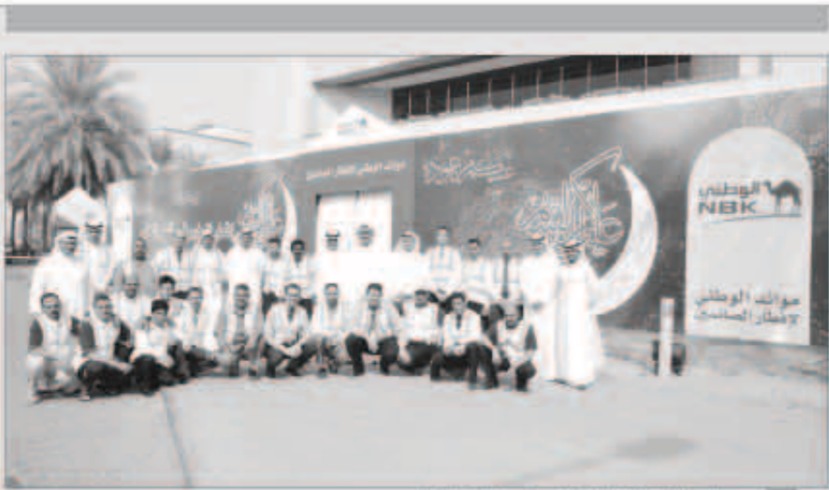
موظفو البنك الوطني المتطوعين مع قيادات البنك