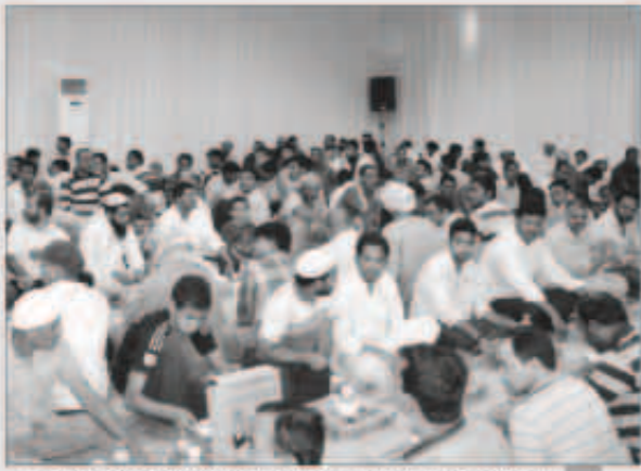
متطوعو البنك الوطني يستقبلون الصائمين في خيمة موائد الخير

شارك عشرات المتطوعين من موظفي بنك الكويت الوطني في البرنامج الاجتماعي الخيري لشهر رمضان المبارك «أفعل الخير في شهر الخير». وكانوا في استقبال الصائمين على موائد الإفطار في خيمة البنك الوطني مقابل المسجد الكبير، كما جابوا بقوافل السيارات مناطق الكويت التي تشهد كثافة سكانية وقاموا بزيارات ميدانية يومية إلى عدد من المستشفيات والمساجد فقدموا وجبات الإفطار إلى عدد كبير من الصائمين بالإضافة إلى الماء والتبر خلال العشر الأواخر من الشهر الفضيل.