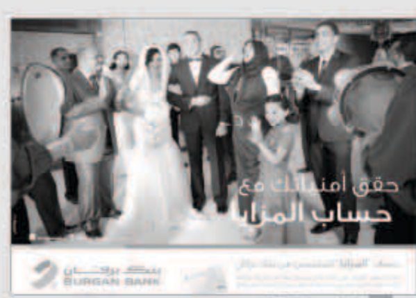
شعار حساب المزايا

الفوز بمرات عديدة مع زيادة الرصيد المدخر في الحساب. هذا ويحتفي حساب يومي حالياً بحضور واسع في السوق الكويتي ويظهر هذا من خلال الارتفاع المتزايد في عدد العملاء الذين يقومون بفتح الحساب. على سعيد آخر.. أعلن بنك برقان عن إعادة إطلاق حساب المزايا بميزات جديدة تم تصميمها لتناسب جميع احتياجات المقيمين في الكويت. هذا ويحصل أصحاب حساب المزايا على بطاقة ائتمان