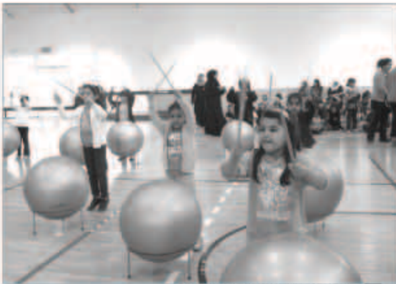
جانب من المشاركين في الاحتفال باليوم العالمي للسكر