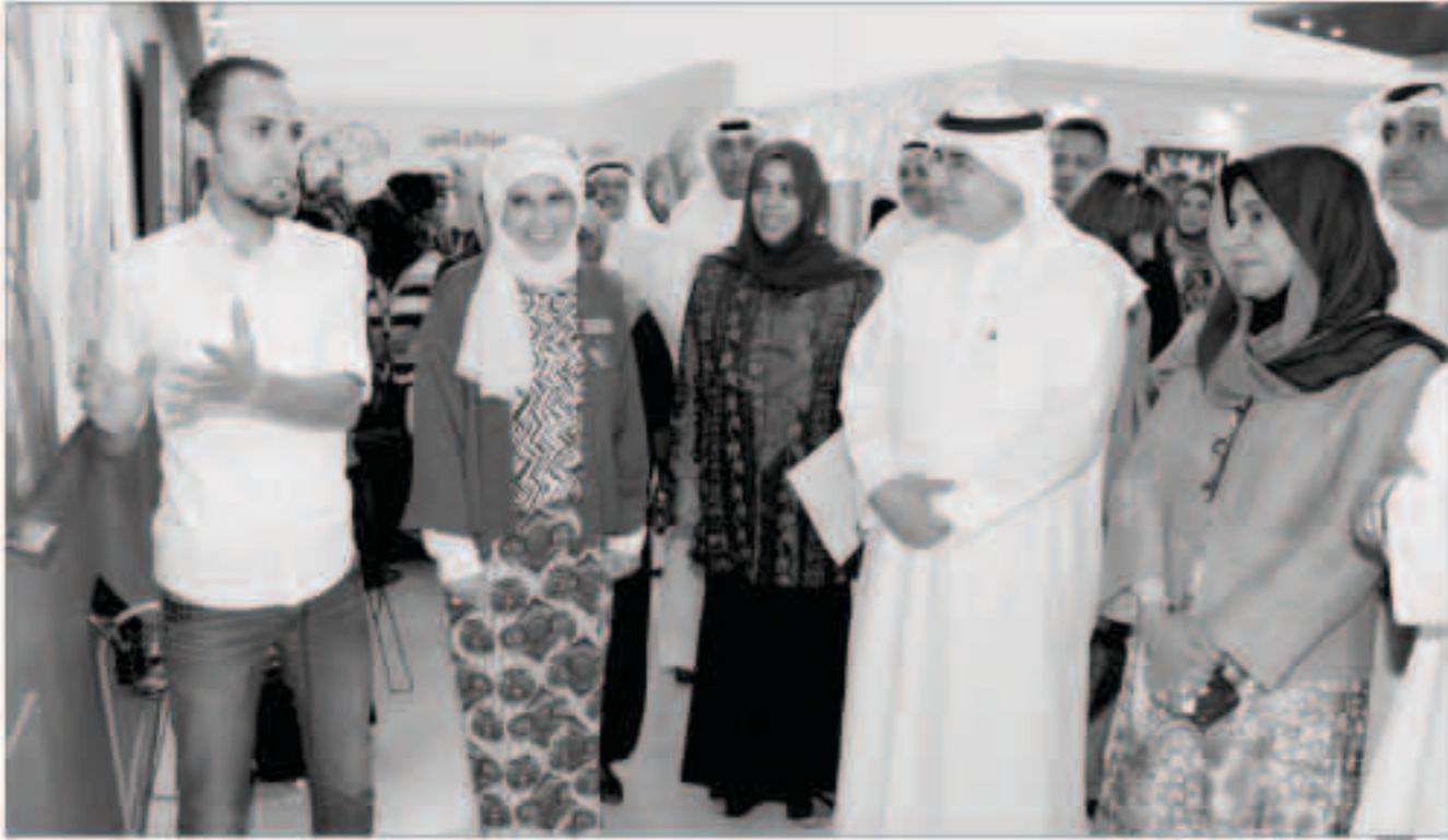
التميز والفوزان من جولة بالمعرض