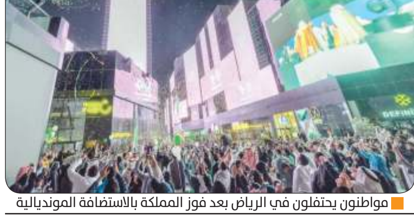
مواطنون يحتفلون في الرياض بعد فوز المملكة بالاستضافة الموندリアルية

2034م، بالتزامن مع فوز المملكة باستضافة كأس العالم، وأبهرت عروض الدرونز أهالي وزوار المحافظة برسوماتها المذهلة والمتعددة التي استخدم خلالها المئات من الطائرات «الدرون» المضيئة، وشكلت صوراً لعلم المملكة وشعار استضافة كأس العالم «معا نمو»، بالإضافة إلى رسومات لقمصان المنتخب السعودي وعبارتي «أهلاً بالعالم» وتزينت شوارع وميادين محافظة جدة، بالأعلام والألوان الخضراء، بمناسبة بفوز المملكة باستضافة كأس العالم 2034، تحت شعار «معا نمو». وشهدت الطرق العامة والميادين بجدة، منها طريق الملك عبدالعزيز، وطريق الأمير محمد بن عبدالعزيز «التحلية»، وشارع السلام والكورنيش