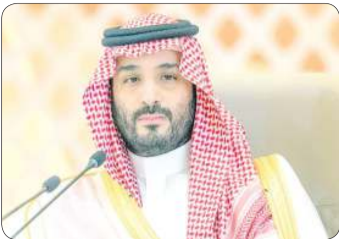
ولي العهد السعودي الأمير محمد بن سلمان

واختتم تصريحه قائلاً: «إن فوز السعودية بحق استضافة هذا المحفل الكروي العالمي، يأتي ضمن ثمار التقدم والتطور الكبير الذي يشهده القطاع الرياضي على الصعيد كافة، في ظل الدعم غير المسبوق من قيادة هذا الوطن العظيم، بما يتماشى مع المستهدفات الرياضية في رؤية المملكة 2030، والتي نوعية استثنائية، انعكست على المجتمع المحلي والرياضة واقتصاد المملكة على حدٍ سواء»