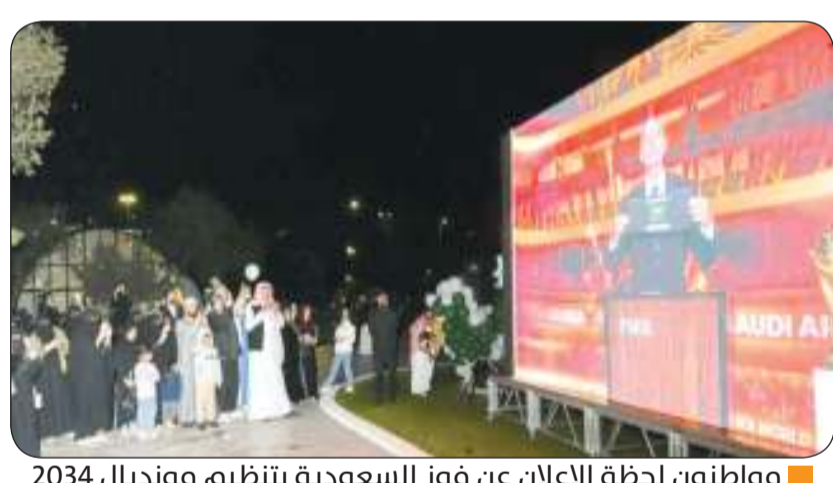
مواطنون لحظة الإعلان عن فوز السعودية بتنظيم موندリアル 2034

وزينت الجوف العديد من الشوارع والميادين بالأعلام ولوحات العبارات الوطنية، فيما عبر المواطنون عن الفرح والاعتزاز من خلال رايات وأوشحة الوطن، كما تبادل بعض المحتفلين السورود والحلوى بهذه المناسبة. ومن جهة ثانية أكتست مبانى وزارة الداخلية وإمارات المناطق والقطاعات الأمنية، اللون الأخضر ابتهاجاً بفوز المملكة باستضافة كأس العالم. وتأتي مبادرة وزارة الداخلية ضمن سلسلة من فعاليات المشاركة في هذا الإنجاز الذي يعكس مكانة المملكة عالمياً، والتحويلات الاستثنائية التي تشهدها من خلال رؤية السعودية 2030 في مختلف المجالات، بما في ذلك استضافة كأس العالم 2034، لتقديم نموذج جبرن قدرات المملكة على تنظيم الأحداث الكبرى وتزينت سماء منطقة القصيم وعدد من الميادين وبرج المياه بمدينة بريدة مساء اليوم، بالألعاب النارية؛ احتفالاً بفوز المملكة باستضافة كأس العالم وجاء ذلك وسط احتفالات المنطقتين بهذه المناسبة التاريخية، التي تمثل جزءاً من مرحلة جديدة، تجسد مكانة المملكة الراسخة على الصعيد الدولي، التي تبرز قدرتها الفائقة على إدارة وتنظيم أكبر الفعاليات الرياضية.