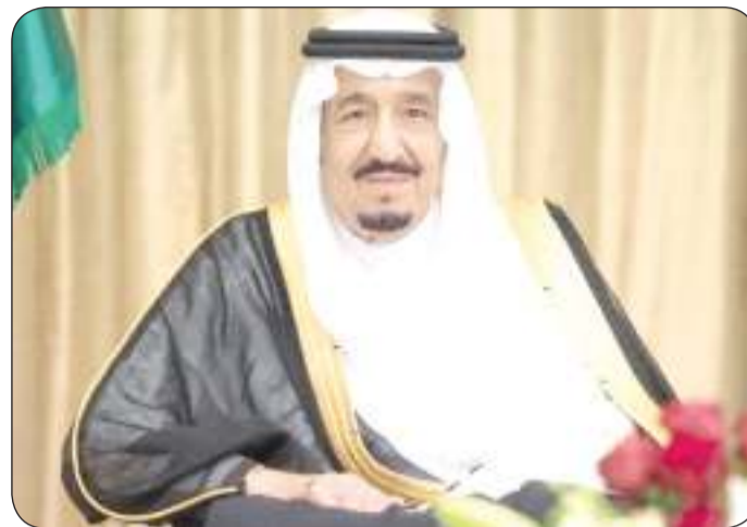
خادم الحرمين الشريفين الملك سلمان بن عبد العزيز

عازمون على المساهمة الفعالة في تطوير لعبة كرة القدم حول العالم تأسيس الهيئة العليا لاستضافة كأس العالم 2034 في كرة القدم وزير الرياضة السعودي: لحظة تاريخية ومحطة سنطلق منها الرياضة السعودية نحو آفاق جديدة