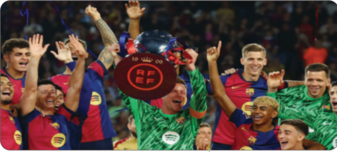
لاعبو برشلونة يحتفلون بالدوري الإسباني

المشاركة في الدوري الأوروبي بالموسم المقبل. أما أتلتيكو مدريد، فرفع رصيده إلى 73 نقطة في المركز الثالث. وفي مواجهة أخرى بنفس التوقيت، حقق ريال مدريد فوزا معنويا خارج ملعبه أمام إشبيلية بهدفين سجلهما كيليان مبابي وجود بيلينغهام في الدقيقتين 75 و 85. ورفع ريال مدريد رصيده إلى 81 نقطة في المركز الثاني، بينما تجمد رصيده عند 41 نقطة في المركز السادس ليكتفي