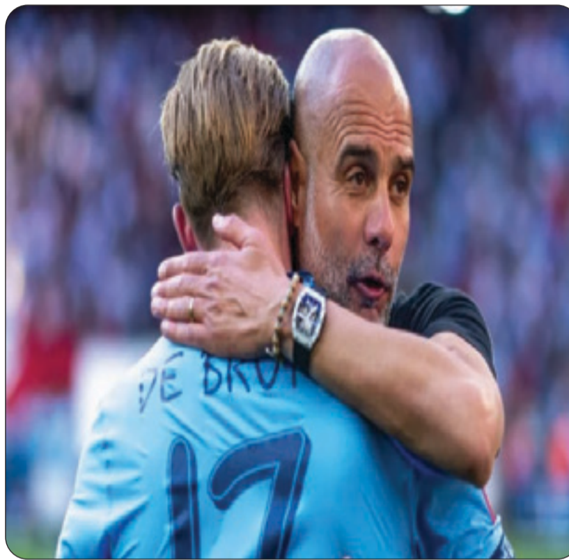
بيب غوارديولا وكيفن دي برون

ويواصل: "سبح الله اليوم الثلاثاء نظيره بورنموث في اللحظة الأنسب، تقديرا لما قدمه، لولا، لما تمكنا من تحقيق ما أنجزناه". وأضاف غوارديولا: "لعبنا نهائي كأس الاتحاد الإنجليزي بشكل جيد جدا، لكننا لم نفعل ما يكفي من أجل الفوز، سنخوض الآن آخر مباراتين في الدوري الإنجليزي الممتاز، نحتاج إلى 4 نقاط من أجل التأهل إلى دوري أبطال أوروبا، ويجب أن يكون الجميع على وعي بذلك".