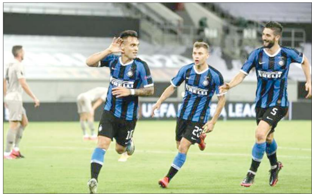
الانتر لن يتخلى عن انتفاضته

دام سنوات، بالنظر إلى التطور الذي ظهر على الفريق في الموسم الماضي، وتحديدا منذ استئناف النشاط بعد التوقف بسبب أزمة كورونا. ولم يخسر ميلان في 12 مباراة متتالية بالدوري، بعد الاستئناف، كما ضرب بقوة يوفنتوس ولاتسيو. وبرز أيضا نابولي في هذا الصدد، لا سيما أنه ظهر بمستويات جيدة تحت قيادة جينارو جاتوزو، المدير الفني الذي تولى المهمة خلفا لكارلو أنشيلوتي، في الموسم الماضي، ليتوج بكأس إيطاليا بعد التغلب على يوفنتوس في النهائي بركلات الترجيح. وحال نجح البارتينوبي في الحفاظ على قوامه الأساسي، خاصة بالإبقاء على كاليدو كوليبالي، مع ضمه لعنصر هجومي مميز مثل فيكتور أوسيمين، قد نشهد عودة فريق الجنوب للمنافسة على القمة هذا الموسم.