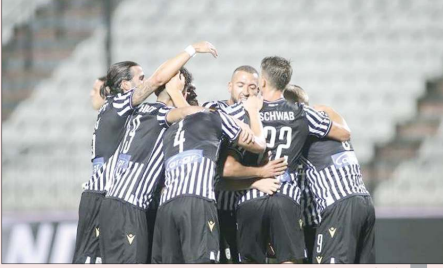
فرحة لاعبي باوك

الوقت لتجنب هزيمة مخجلة، ستفرض ضغوطا على المدرب جورج جيسوس الذي عاد لبنفيكا هذا الصيف لبدء فترة ثانية مع النادي. وتحصل دينامو، ضغط الكمار قبل أن يضعه مهاجم لوكسمبورغ، جيرسون رودريغيز في المقدمة بعد الاستراحة، وضمن ميكولا شاربينكو الانتصار بضربة رأس قبل النهاية. ومنح نيكلاس دورش التقدم لجنيت في الدقيقة 36 أمام رابيد، وأضاف رومان باريمتشوك الهدف الثاني من ركلة جزاء، بينما سجل يوسف ديمير هدف حفظ ماء الوجه للزوار في الوقت المحتسب بدل الضائع.