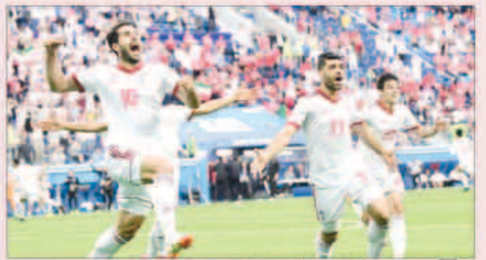
من مباراة سامعة لمنتخب إيران في كأس العالم الأخيرة

المحدث عن الاتحاد الإيراني أن الحسابات تعرضت للتجميد بالفعل ولكن الاتحاد سيحاول حل المشكلة في الأيام المقبلة. ويعاني الاتحاد الإيراني لكرة القدم من أزمة مالية منعدمة من تعدد التعاقد مع الحرب البرتغالي كارلوس كيروش، وذلك بسبب العقوبات الأميركية المفروضة على إيران.