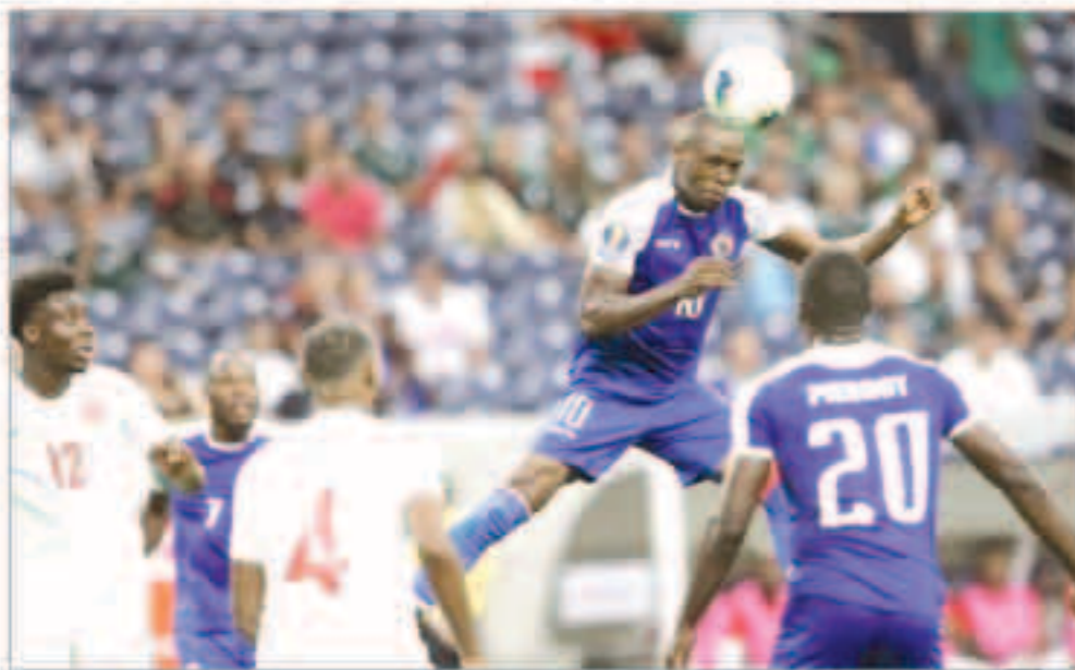
من لقاء هايتي وكندا