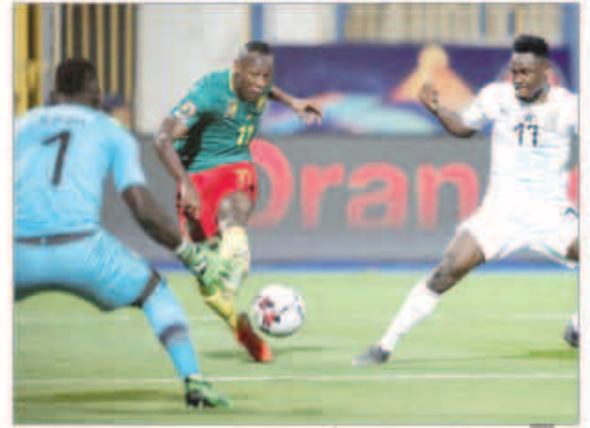
الكامبيرون تتفوق على غانا بفارق الأهداف