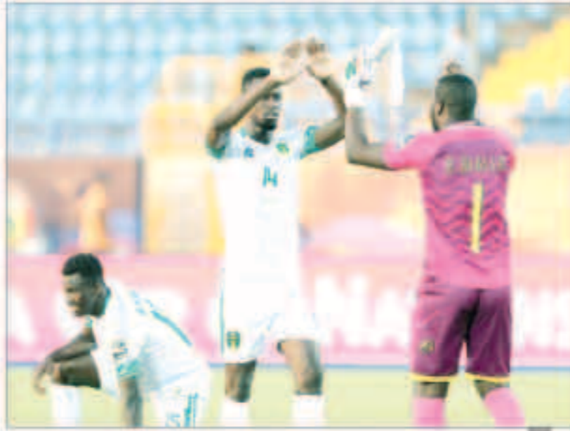
لاعب موريتانيا يحتفلون بعد نهاية المباراة