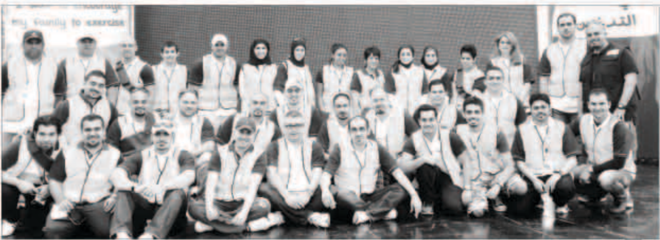
المتطوعون من موظفي البنك الوطني خلال سباق للمشي في مارس الماضي