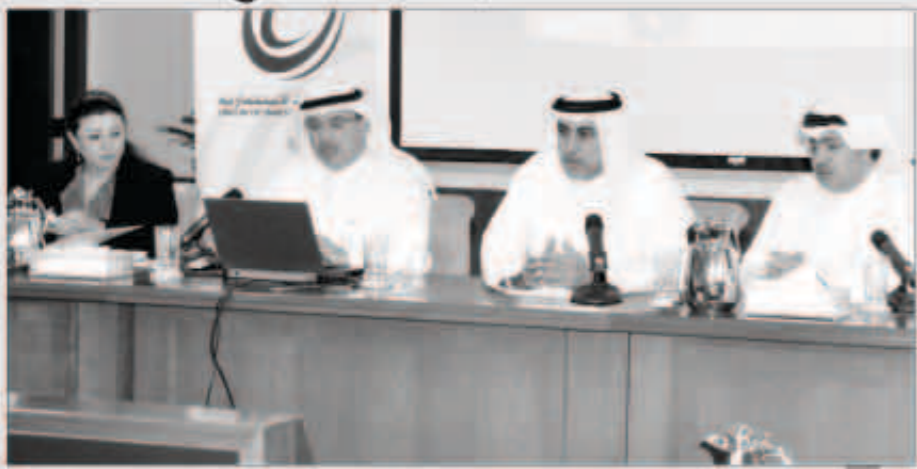
السيبي والسلي والشرح ودرؤيش خلال اللقاء

قدم اتحاد الشركات الاستثمارية لقاء تشاوري جمع مجلس إدارة الاتحاد مع الشركات الأعضاء في مبنى غرفة تجارة وصناعة الكويت، حيث تضمن اللقاء عرضاً لجهود وأنشطة الاتحاد وكذلك مركز الدراسات الاستثمارية والخدمات المالية خلال الفترة من 2012/2/15 حتى 2013/6/25 والذي