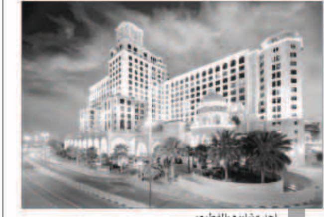
أحد مشاريع «المفيم»

في المئة، وتوفير استهلاك المياه الخارجي بنسبة تصل إلى 50 في المئة. وقد انخفض استهلاك فندق كمبينسكي مول الإمارات لطاقة بنسبة تخلفت 12 في المئة والمياه بالنسبة 10 في المئة بين عامي 2010 و2012. وعموما، حققت محفظة الفنادق التابعة لـ «ماجد الفطيم العقارية»، في الفترة بين عامي 2009 و2012 وفورات بنسبة 15 في المئة في الطاقة و14 في المئة في المياه، بينما سجلت زيادة بنسبة 10 في المئة في معدل الدورير. كذلك حصل «بيروت سيتي سنتر»، وهو مركز التسوق المتكامل التابع لـ «ماجد الفطيم العقارية»، في لبنان والذي يمتد على مساحة 60.000 متر مربع، على شهادة ليد الفضية، واضعا معيارا للإستدامة البيئية لجميع مراكز التسوق التي سيتم إنشاؤها في لبنان مستقبلا. وفي العام 2012، كانت ماجد الفطيم العقارية أول شركة تكشف عن مستويات استهلاك الطاقة لديها وكفاءة استثماراتها على مستوى دولة الإمارات، وتعمل الشركة مع مركز دبي المتميز لضبط الكربون «DCC» لتصبح أول شركة تجزئة في المنطقة تسجل في آلية التنمية النظيفة التابعة للأمم المتحدة «CDM»، في إطار بروتوكول كيوتو.