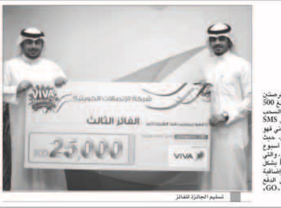
تسليم الجائزة للفائز

قال رئيس المحللين الاقتصاديين في منطقة الشرق الأوسط وشمال أفريقيا في بنك «إنش اس بي سي» سيمون وليامز إن الكويت بعيدة عن تأثيرات أزمة منطقة اليورو في ظل استفادة الكويت من أسعار النفط عند 100 دولار للبرميل، والفوائض الضخمة الناتجة من عائدات النفط، وأضاف وليامز، في لقاء على هامش المؤتمر الصحافي السنوي لبنك «إنش اس بي سي» أمس، أن قرار الكويت في ربط عملتها بسلة من العملات كان صائباً، خصوصاً أن القرار جاءها الكثير من التقلبات التي شهدتها الدولار خلال السنوات القليلة الماضية. وتوقع وليامز أن يستمر الارتفاع في الفوائض المالية في المنطقة.