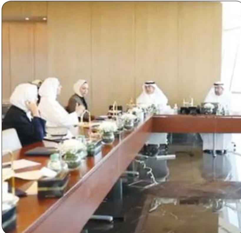
وكيل وزارة التربية د. علي اليقوب خلال اجتماعه أمس مع الوكلاء المساعدين

وأضافت أنها تعكف على تقديم حلول لضمان استمرار أنظمتها على المدى البعيد بالتعاون مع الجهات الأخرى في الدولة وتعمل جاهدة لتحقيق الأهداف التي أنشئت من أجلها عبر تطوير القوانين والمحافظة على استدامة أنظمتها.