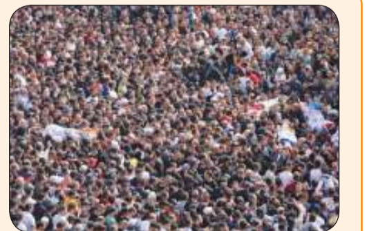
جنازة ضخمة في نابلس لتشييع الفلسطينيين الذين قتلوا بهجوم إسرائيلي

السلطة الفلسطينية تحذر من وضع «أخطر مما تتصوره» تل أبيب وواشنطن في نابلس