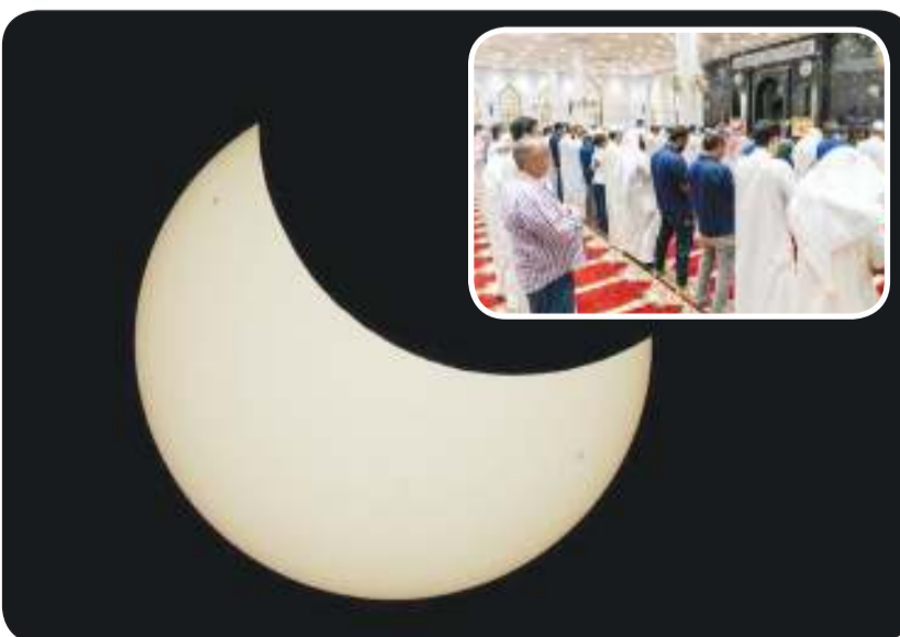
كسوف شمس الكويت في ذروته أمس.. وفي إطار مساجد البلاد أقامت «ملاة الكسوف» تأسياً بالسنة النبوية

مساجد البلاد أقامت صلاة خاصة عند الساعة الواحدة والنصف عملاً بسنة النبي