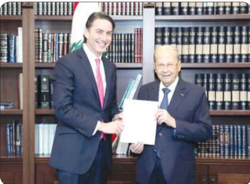
الرئيس اللبناني عقب توقيع اتفاق ترسيم الحدود أمس

الوسيط الأمريكي: يوم تاريخي وأمل أن يكون التوقيع على الاتفاق نقطة تحول للرفين