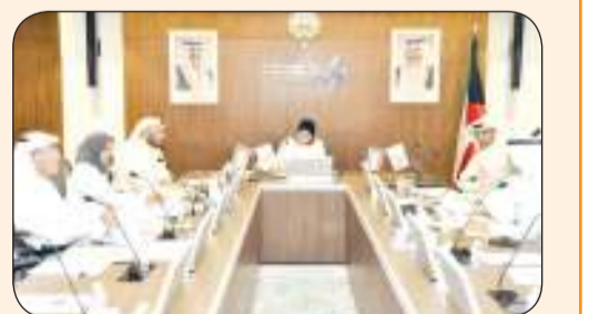
وزيرة الكهرباء د. أماني بوقمار مترتبة اجتماع اللجنة العليا للطاقة