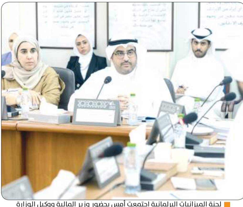
لجنة الميزانيات البرلمانية اجتمعت أمس بحضور وزير المالية ووكيل الوزارة

سائلاً سموه المولى جل وعلا أن يديم على أخيه خادم الحرمين الشريفين موفور الصحة والعافية، لمواصلة قيادة مسيرة الخير والنماء في البلد الشقيق، وخدمة قضايا الأمتين العربية والإسلامية، وأن يحقق للمملكة العربية السعودية الشقيقة وشعبها الكريم المزيد من التقدم والأزدهار، في ظل القيادة الحكيمة لخادم الحرمين الشريفين الملك سلمان بن عبد العزيز، وبمؤازرة صاحب السمو الملكي الأمير محمد بن سلمان بن عبدالعزيز آل سعود ولي العهد ورئيس مجلس الوزراء، وبعث سموه ولي العهد الشيخ مشعل الأحمد، وسمو الشيخ أحمد النواف رئيس مجلس الوزراء، ببرقيتي تهنئة ماملتين.