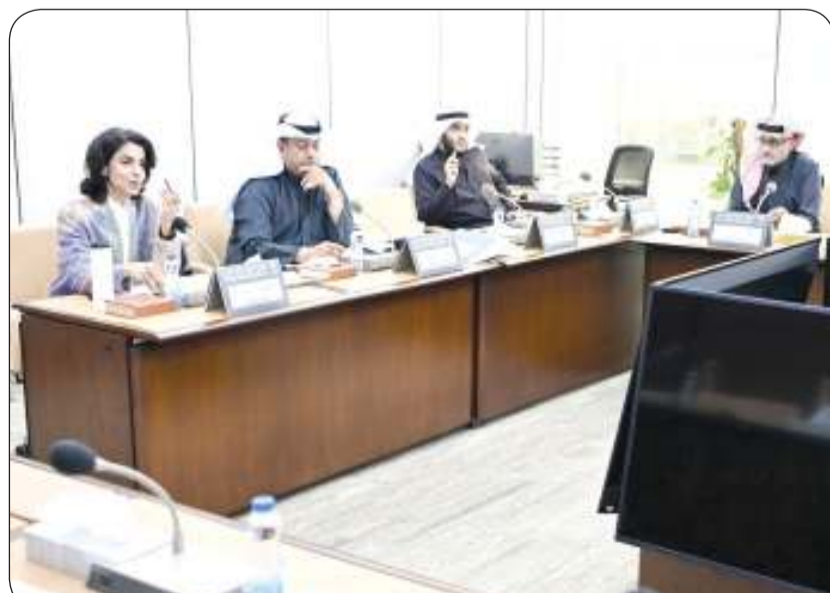
اللجنة التعليمية واصلت أمس بحث قضية الشهادات العلمية المزورة والوهمية

المطر: المزور من جنسية عربية مسجون لمدة تتجاوز 30 عاماً مستمرون في كشف أبعاد القضية ومتابعتها لرفع تقرير حولها إلى المجلس