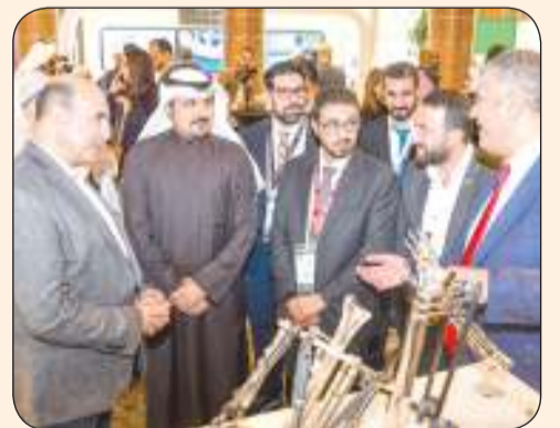
الوكيل المساعد مشعل الكندري خلال جولته في المعرض المصاحب لمؤتمر جراحة العظام

الكندري: تطور القطاع الصحي ثمرة جهود مديروسة بعناية لتقديم أفضل خدمة ورعاية