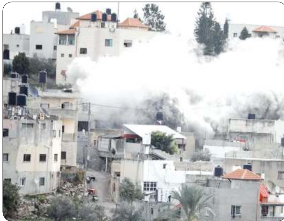
قوات الاحتلال الإسرائيلي اقتحمت مخيم جنين وقتلت 9 من أبناء الشعب الفلسطيني

أعربت وزارة الخارجية عن إدانة واستنكار دولة الكويت الشديدة، للعدوان الوحشي الذي شرعت به قوات الاحتلال الإسرائيلي على مدينة جنين في الضفة الغربية المحتلة، والذي أسفر عن استشهاد وإصابة أرباب. وأكدت الوزارة في بيان لها أمس، أن هذا العدوان يعد انتهاكاً صارخاً لقرارات الشرعية الدولية والقانون الدولي، داعية المجتمع الدولي إلى التحرك السريع والفاعل لوقف هذه الانتهاكات الإسرائيلية المستمرة وتوفير الحماية الكاملة للشعب الفلسطيني الشقيق. وحذرت من مغبة هذه الانتهاكات التي تنذر بالمزيد من التصعيد، محملة سلطات الاحتلال الإسرائيلي المسؤولية كاملة لتداعيات هذه الاعتداءات المتكررة.