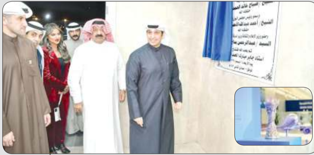
الوزير عبد الرحمن المطيري واليوسف وعبدالله خلال افتتاح إستاند «جابر المبارك».. وفي الإطار كأس «خليجي 26»

وأزاح الوزير المطيري الذي يرأس اللجنة المنظمة العليا للبطولة الستار عن جدارية الافتتاح التذكارية الخاصة بهذه المناسبة حيث قام بجولة تفقدية في مرافق الملعب الذي يتسع لنحو 15 ألف متفرج، وغرف اللاعبين والحكام وغرفة "الكنترول" لكاميرات الملعب، وغرفة البث والتلفزيوني ومنصة كبار الشخصيات ومدربات الجماهير.