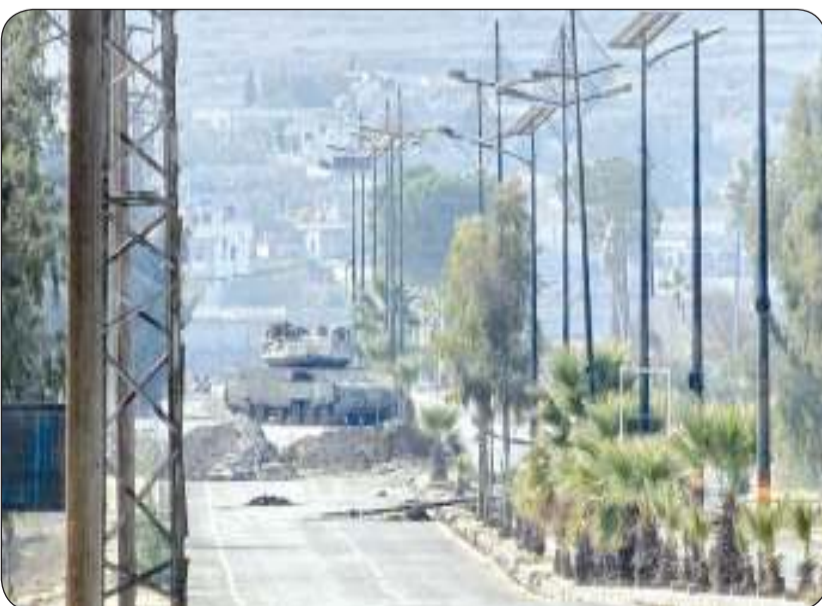
دبابة إسرائيلية خلال توغل قوات الاحتلال في القنيطرة السورية

4 فرق قتالية تابعة لجيش الاحتلال في الجنوب السوري .. وواشنطن تطالب بـ «تساور وثيق»