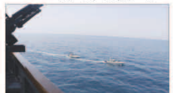
سفن إيرانية تقرب من باخرة أمريكية

واشنطن - «وكالات»: في وقت تهدد إيران بالرد على السفن الأمريكية وإغراقها، كشف البنتاغون عن تقنية متطورة يمكنها استهداف وإغراق السفن الإيرانية، حتى قبل أن تبدأ في التحرك لمهاجمة الأهداف الأمريكية.