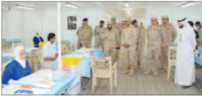
رئيس الأركان، يعرب عن فخره برجال الجيش لمساندتهم مؤسسات الدولة