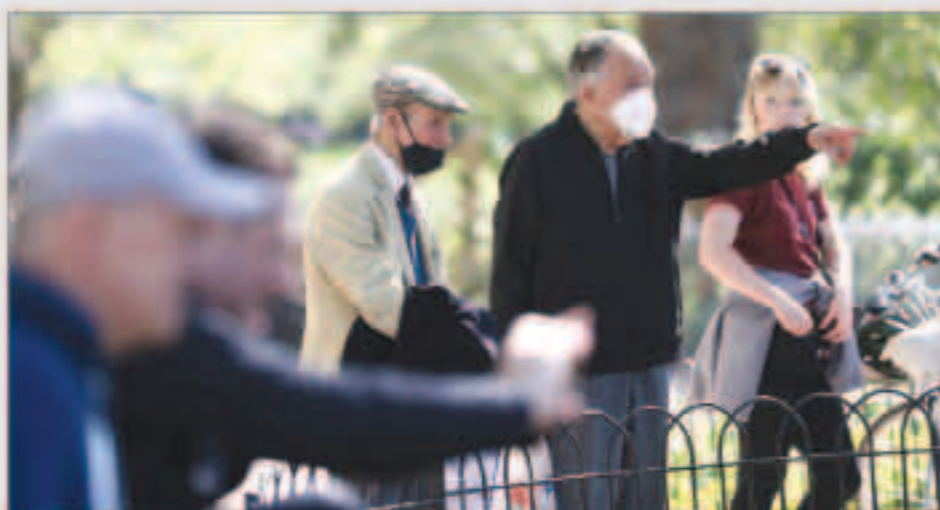
البريطانيون يتخذون احترازا شديدا لوقاية من كورونا

بريطانيا: معدل الخسائر البشرية بسبب «كوفيد 19» لن يبدأ التراجع بسرعة إلا خلال بضعة أسابيع سباق عالمي للتوصل للقاح يقضي على «كورونا» وترجيحات بأنه لن يكون جاهزا قبل سبتمبر