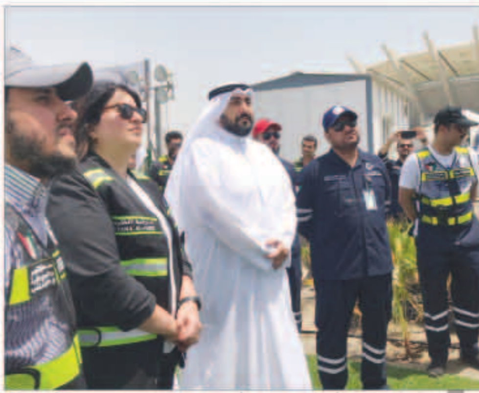
وزيرة الأشغال تسلم المرحلة الأولى من المحجر الصحي الأكبر بحضور وزير الصحة

تنفيذ وتجهيز المحجر تم في سياق الخطط الاستباقية للتعامل مع «الفيروس» وتركيز جهود الطواقم الطبية دون تشتيت نفخر بما تقوم به الكوادر الوطنية من جهود جبارة مواصلة الليل بالنهار لتجاوز المحنة الفيلكاوي: المرحلة الأولى 1250 سريراً وسيتم لاحقاً تسليم الباقي تعاقباً على ثلاث مراحل عبد العزيز الصباح: هذا الإنجاز تم تنفيذه بإشراف قطاع «هندسة الصيانة» و«كوادر وطنية وفق أعلى معايير الجودة»