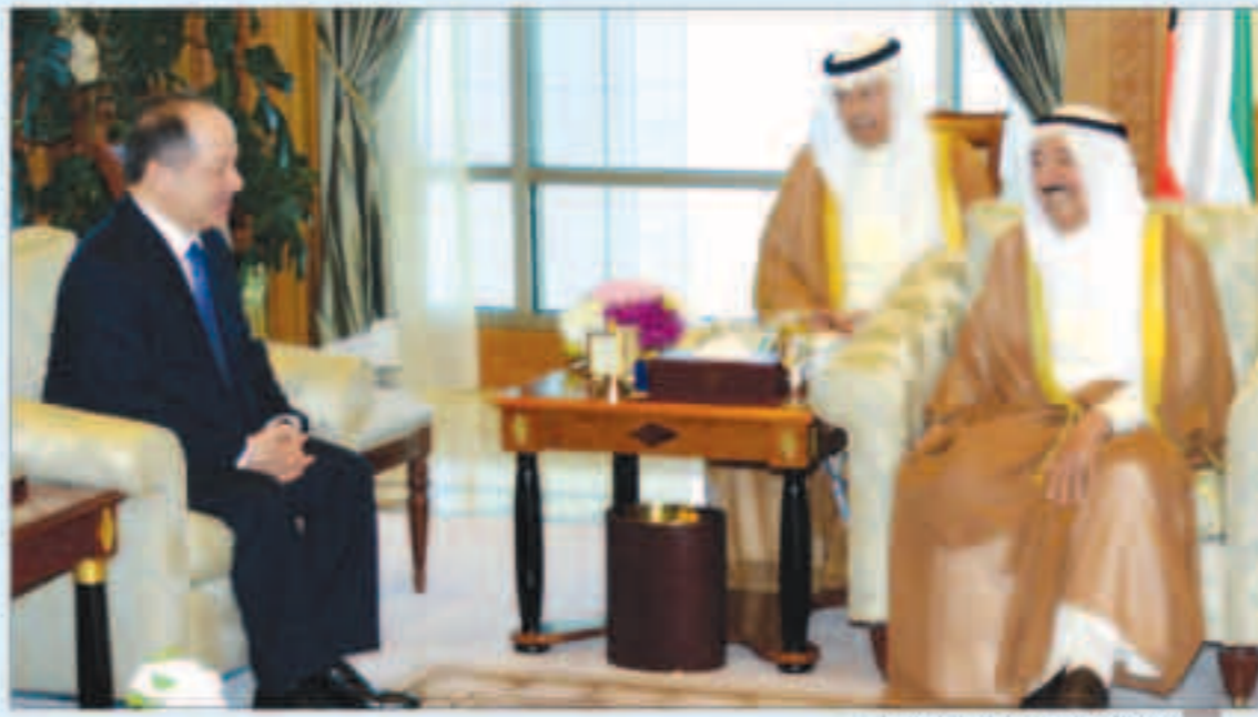
سمو الأمير لدى استقباله البارزاني أمس

«كونا» : استقبل سمو أمير البلاد الشيخ صباح الأحمد بقصر السيف صباح أمس، وبحضور سمو ولي العهد الشيخ نواف الأحمد، رئيس إقليم كردستان العراق مسعود البارزاني والوفد المرافق، وذلك بمناسبة زيارته للبلاد. كما استقبل سمو ولي العهد الشيخ نواف الأحمد بقصر بيان ظهر أمس، وبحضور سمو الشيخ جابر المبارك رئيس مجلس الوزراء، رئيس إقليم كردستان العراق مسعود البارزاني والوفد المرافق له. وقد أقيم سمو ولي العهد بقصر بيان «اللقاء الرئيسية»، ظهر أمس، مأدبة غداً على شرف البارزاني رئيس إقليم كردستان العراق والوفد المرافق له.