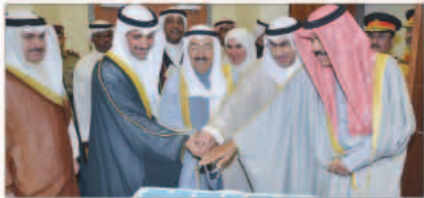
الأمير كرم المتفوقين من خريجي «التطبيقي»