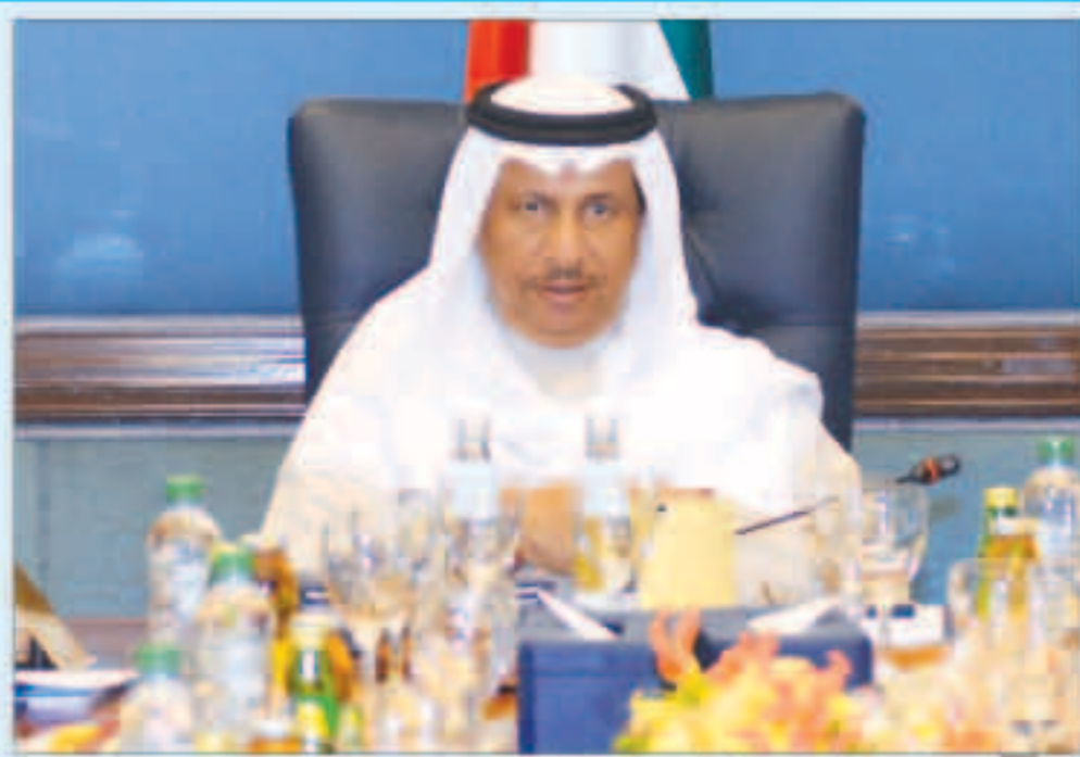
سمو الشيخ جابر المبارك يترأس اجتماع مجلس الوزراء أمس

الشاهين: نطالب باستقالة أي عضو له مصلحة في موضوع التحقيق لتعارض وجوده مع القانون الهاشم: الحكومة غير ملزمة بمعالجة الوافدين وفتاورة العلاج بالخارج وصلت إلى مليار و400 مليون دينار عسكر: تلقيت وعداً من وزير الدفاع بقبول دفعة من أبناء العسكريين البدون للالتحاق بالجيش الكويتي