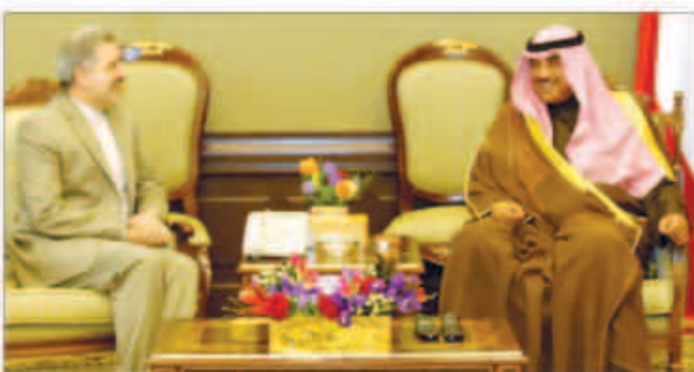
الشيخ صباح الخالد يتسلم من السفير الإيراني رسالة موجهة لسمو الأمير من الرئيس روحاني

مراقبون: التحرك الدبلوماسي الكويتي يبشر بقرب حل أزمات المنطقة