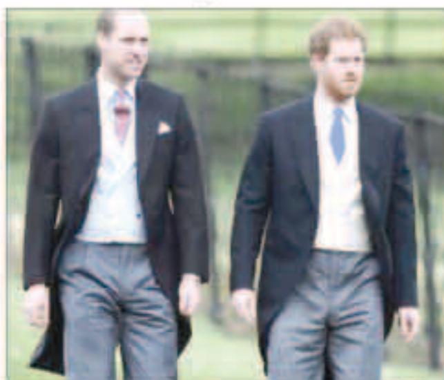
الأميران وليام وهاري

لندن - «رويترز» - أهدى الأميران وليام وهاري التمدد على الاستحجال في آخر اتصال هاتفي مع والدتهما الأميرة ديانا قبل وفاتها فالتين إن الخلة «كانت سريعة جدا».