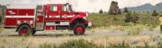
عشرات الحرائق تجتاح غرب كندا وكاليفورنيا إثر موجة الحر

كذلك، كان يعمل على إعادة فيلم هوليوود الشهير «فورست غامب» الصادر عام 1994. بعنوان «لال سينغ شادا» من المقرر طرحها في نهاية عام 2021.