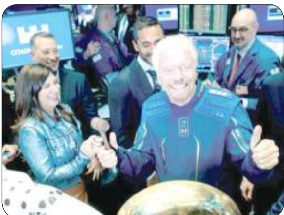
البريطاني ريتشارد برانسون يهتم باستكشاف الفضاء

«وكالات»: سيقام رجل الأعمال الملياردير البريطاني ريتشارد برانسون، إلى حافة الفضاء على متن الرحلة التجريبية لشركة «فيرجن جالكتيك هولدنجز» في 11 يوليو، وهو ما يجعله يسبق الملياردير جيف بيزوس.