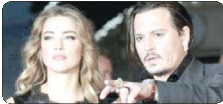
جونني ديب مع طليقته أمبر هيرد