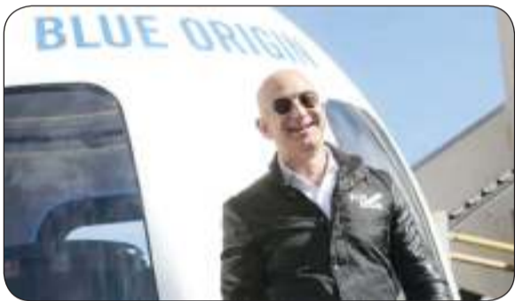
جيف بيزوس أمام مركبة لشركته بلو أوريجن

«وكالات»: بعد أشهر من التنديد بقرار ناسا اختيار «سبايس إكس» لصنع مركبتها المقبلة للهبوط على القمر، أعلنت «بلو أوريجن» أنها قدمت شكوى أمام محكمة فدرالية ضد وكالة الفضاء الأمريكية.