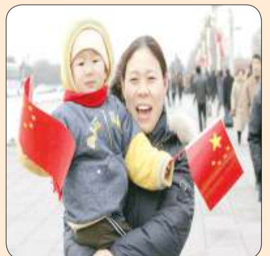
امرأة صينية مع طفلها

وقال ديب لصحيفة «صنداى تايمز»: «هوليوود قاطعتنى خلال السنوات الخمس الماضية، الجميع وقف ضد ممثل واحد، وقد كان هذا الأمر حزينا وفوضويا».