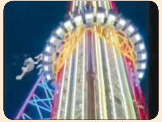
الفتى الضحية وهو يسقط

ونشرت وسائل الإعلام المحلية مقاطع فيديو متداولة على الشبكات الاجتماعية، حيث يُسمع ركاب الجذب يتحدثون عن سلامة المقاعد، وبعد ذلك تبدأ الآلة في تحريك الأشخاص إلى الأعلى. وأعرب جون ستاين، مدير المبيعات والتسويق في مجموعة Slingshot، الشركة التي تمتلك الجذب، عن أسفه لهذا الحدث وأشار إلى أنهم يتعاونون مع السلطات.