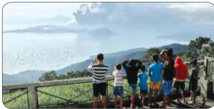
بركان تال في الفلبين