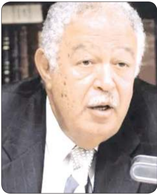
نقيب المحامين رجائي عطية

«وكالات»: توفي ظهر أمس السبت، نقيب المحامين في مصر، رجائي عطية، إثر تعرضه لوعكة صحية أثناء نظر جلسة محاكمة المحامين أمام جنائيات إمبابة. وأعلن الأمين العام المساعد لنقابة المحامين، أبو بكر ضوة، عن وفاة نقيب المحامين إثر تعرضه لأزمة قلبية مفاجئة أثناء نظر جلسة محاكمة المحامين أمام جنائيات إمبابة. وأفادت الأنباء المتداولة، بسقوط النقيب العام للمحامين ورئيس اتحاد المحامين العرب، البالغ من العمر 84 عاماً، مغشياً عليه أثناء المرافعة في محكمة جنوب الجيزة للحضور في قضية محامين شمال الجيزة، وجرى نقله بسيارة إسعاف إلى المستشفى. وولد عطية، عام 1938 بشبين الكوم في محافظة المنوفية في مصر، ويرأس منذ 2020 نقابة المحامين المصرية.