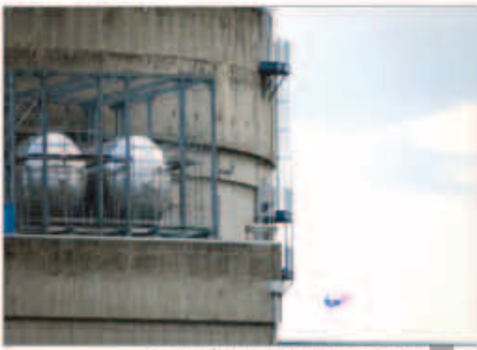
طائرة على شكل سوبرمان تصطدم بمفاعل نووي فرنسي

قالت متلفة السلام الأخضر «جرينبيس» إنها أرسلت طائرة بدون طيار على هيئة سوبرمان للأصطدام بمفاعل نووي فرنسي أول أمس وتسلط الضوء على مخاطر تعرض المنشآت النوية لهجمات خارجية. وأضافت أن الطائرة التي تحرك فيها أحد نشطاء المتلفة دخلت منطقة حظير طيران حول مفاعل بوجيه النووي التابع لشركة كهرياه فرنسا قرب مدينة إيون ثم واصطدمت بجدار مبنى تبريد الوقود المستنفذ بالمفاعل، صبيما ذكرت «رويترز» وتابعت «تسلط هذه الخطوة مرة أخرى الضوء على هشاشة هذا النوع من المباني التي تحتوي على أكبر قدر من النشاط الإشعاعي في المفاعلات النووية».