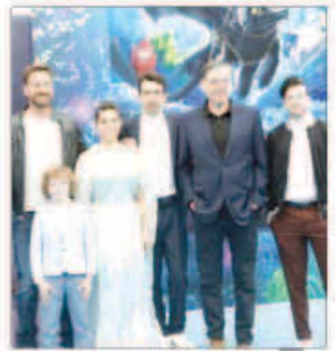
فريق عمل فيلم «كيف تروض تينيك»

وتراجع فيلم المغامرة والحركة «النتا، ملاك الحركة» (النتابابل انجيل) من المركز الثاني إلى الثالث محققا مبيعاته 24 مليون دولار. تقوم ببطولة الفيلم روزا سالازار وكريستوفر فالتر وجينيفر كونلي ويخرجه روبرت رودريغيز. ونزل أيضا فيلم الرسوم المتحركة (ليجو موفي 2) الجزء الثاني) من المركز الثالث إلى المركز الرابع محققا 6.6 مليون دولار.