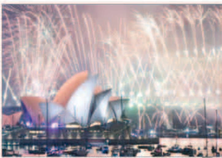
جانب من احتفالات سيدني ببدء عام 2019

«وكالات»: استعداد المحتفلين في جميع أنحاء العالم، أمس، لبدء العام الجديد بالاحتفالات والألعاب النارية. وستكون جزيرة ساموا الواقعة في المحيط الهادئ هي أول المحتفلين بوصول عام 2020 بعد أن حولت منطقتها الزمنية من الجانب الشرقي من خط التاريخ الدولي إلى الجانب الغربي قبل 8 أعوام.