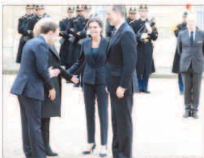
ماكرون يؤدي التحية الهندية

«العربية نت»: لم يتقبل البعض أن يصل الملج من «كورونا» إلى المس بيرونوكولات الاستقبال الراسية حول العالم، لكن هذا ما جرى خلال لقاء الرئيس الفرنسي وملك إسبانيا، مساء أمس الأول. فقد تحاشى الرئيس الفرنسي إيمانويل ماكرون مصافحة الملك فيليب في ساحة قصر الإليزيه، وما كان منه عند استقبال ضيفه إلا أن ضم كفيه وانحنى قليلاً أمام ملك إسبانيا وملكته في باريس، مساء أمس الأول، مستخدماً تحية على الطراز الهندي «ناماسي»، بدلاً من المصافحة التقليدية، وأصفاً في الاعتبار احتمالات نقل العدوى مع انتشار فيروس كورونا المستجد في العالم. في حين أرسلت زوجته التي كانت بجواره قبلة في الهواء باتجاه الملكة ليبريا للتحية. يأتي ذلك ضمن الإخذ بتصاحح سلطات الصحة العامة الأوروبية، القاضية بتجنب المصافحة للحد من انتشار كورونا الذي يمكن أن ينتقل عن طريق للامس الجلد. وكان الرئيس الفرنسي تراسس إلى جانب ملك إسبانيا، مراسم اليوم الوطني الأول تكريماً لخصما الإرهاب في فرنسا، والخصما الفرنسيين في الخارج.