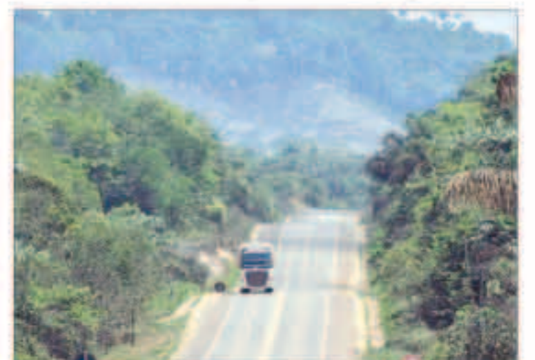
الأمازون: قد تتحول إلى سهول قاحلة في غضون 50 عاماً

«والات»: حذر باحثون في دراسة نشرت في مجلة «نيشتر كومونيكيشنز» من أن غابة الأمازون اقترت من نقطة اللاعودة بسبب التغيير المناخي، وقد تتحول إلى سهول قاحلة في غضون 50 عاماً. وأشار الباحثون في الدراسة نفسها إلى أن نظاماً بيئياً رئيسياً آخر هو الحاجز المرجاني في البحر الكاريبي قد يتبدد بعد 15 عاماً إذا ما تجاوزت أيضاً نقطة اللاعودة. ولفت العلماء إلى أن هذه التغييرات قد يكون لها انعكاسات كارثية على البشر والأنواع الحية الأخرى التي تعتمد على هذه المواطن الطبيعية. وفي المقابل، تعود الأسباب في هذه التغييرات الحاصلة إلى التغيير المناخي الناتج عن النشاط البشري والأضرار البيئية وقطع الأشجار في ما يخص غابة الأمازون، والثلوث وارتفاع الحموضة في مياه المحيطات في حالة الشعب المرجانية. وتفيد أعمال خبراء المناخ في الهيئة الحكومية الدولية المعنية بتغير المناخ في منظمة الأمم المتحدة، بأن 90 بالمئة من الشعب المرجانية في المياه الضحلة ستنتثر سلباً إذا ارتفعت حرارة الأرض 1.5 درجة مئوية مقارنة بما كانت عليه قبل الثورة الصناعية.