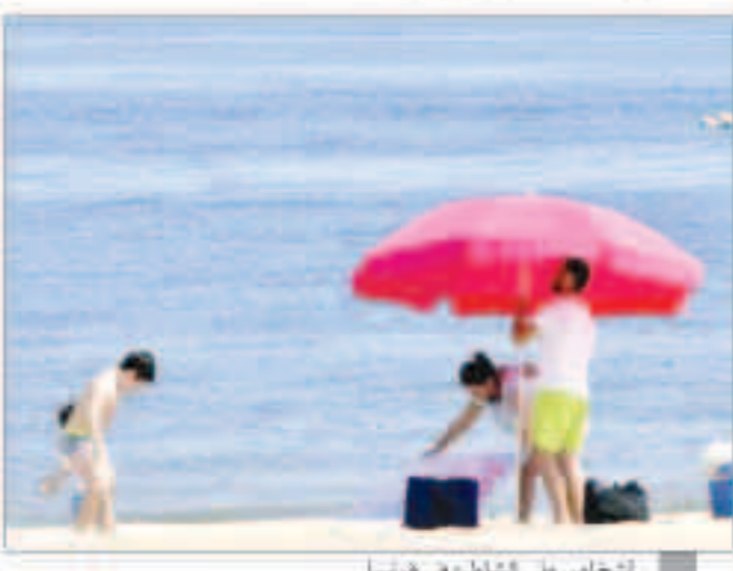
اشخاص على الشاطئ في فرنسا

«وكالات»: يسارع الأوروبيون بلهفة إلى تحضير حقائب سفرهم واستلزمات حمامات الشمس لقضاء عطلة صيف ما بعد كورونا. ومع ربح القيود وفي وقت يبدو قطاع السياحة في وضع صعب، وضع الاتحاد الأوروبي خططا لإعادة فتح حدوده الداخلية أمس، لكن حتى مع السماح بالسفر ضمن معظم دول الاتحاد الأوروبي، يتوقع أن يقضي الكثير من الأوروبيين عطلاتهم داخل بلدانهم هذا العام، وتبقى الصورة العامة ما يتوقعه المصطلحون الباحثون عن الشمس أو البحر أو التجارب الثقافية، متشابهة انطلاقاً من إسبانيا وإيطاليا مروراً بفرنسا وبريطانيا واليونان. وفي فرنسا، الوجهة السياحية الأولى في العالم، ستعتمد الحكومة على بقاء الفرنسيين في البلاد لقضاء عطلاتهم من أجل المساهمة في إعادة إنعاش قطاع السياحة لمحوري، ولتوفير الرسالة والتذكير الفرنسيين بما هو متاح داخل البلاد، شتعت السلطات إلى إطلاق حملة تحت عنوان «سأزور فرنسا هذا الصيف»، ويبدو أن الكثيرين استجابوا بالفعل للنداء، ووفقاً لرئيس جمعية «إنتربرين دو فواياج» الفرنسية، التي تمثل قطاعات صناعة السفر، فإن 20 في المئة فقط من الحجوزات الصيفية في وكالات السفر حتى الآن مخصصة للرحلات في الخارج.