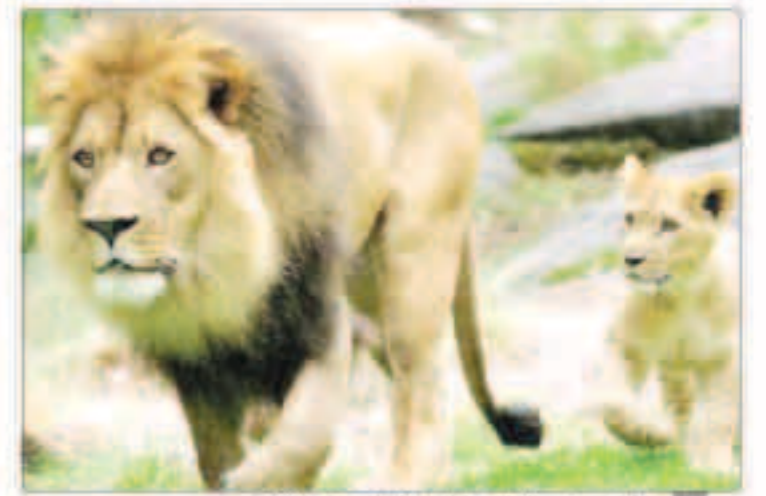
الأسود تعرض للقتل من أجل عظامها في دول إفريقية

وبحسب صحيفة «ديلي ميل» البريطانية، فإن الأمر الأكثر رعباً هو أن كتاب أشكروفت يكشف أن هذه الأسود يمكن أن تنقل أمراضاً قاتلة إلى البشر، بما في ذلك المل أو التسمم الغلاني، كما يمكن أن تكون شرارة لجائحة جديدة.