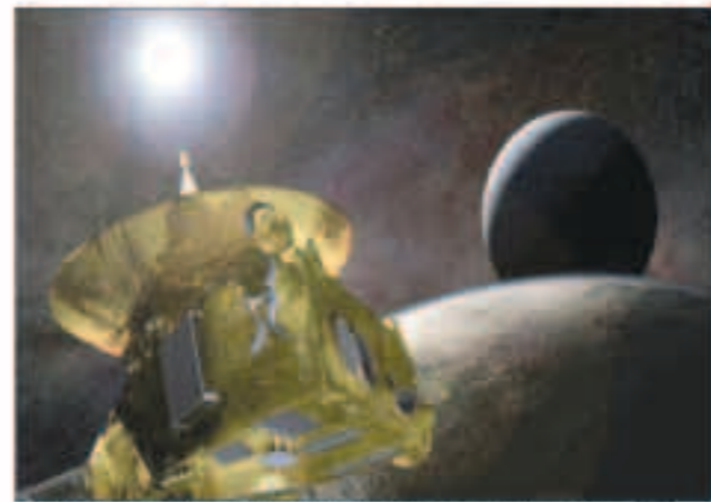
عمل هي لطيفي لمركبة الفضاء «نيو هوريزونز» التابعة لوكالة ناسا

«العربية نت»: التقطت مركبة الفضاء «نيو هوريزونز» التابعة لوكالة الفضاء الأميركية (ناسا) صوراً للنجوم القريبة في مواقع مختلفة عن تلك التي نراها فيها من الأرض، من خلال موقعها الفريد على بعد 4.3 مليار ميل من كوكبنا. وقال عالم الكواكب الآن ستيرن، الباحث الرئيسي في «نيو هوريزونز» في معهد «ساوث ويست» للأبحاث في مدينة بوانير بولاية كولورادو في بيان: «من العدل أن نقول إن نيو هوريزونز تنظر إلى سماء غريبة، على عكس ما نراه من الأرض». وأضاف ستيرن: «لقد سمعنا لنا ذلك يفعل شيء لم يتم تحقيقه من قبل، لرؤية أقرب النجوم التي تنتقل بشكل واضح في السماء من المواقع التي نراها على الأرض». وبحسب ما ذكرته شبكة «سي إن إن» الأميركية، تسافر المركبة «نيو هوريزونز» في مسار إلى الفضاء بين النجوم، وقد قامت بمهمة قبل ذلك لاكتشاف وتصوير كوكب بلوتو والقمره في عام 2015. وفي أبريل، وعلى مسافة 4.3 مليار ميل من الأرض، وجهت «نيو هوريزونز» كاميرتها التليسكوبية بعدة المرات إلى النجوم القريبة Proxima Centauri، و«Wolf 359»، الواقعين على مسافة 4.2 و7.8 سنة ضوئية من الأرض على التوالي.