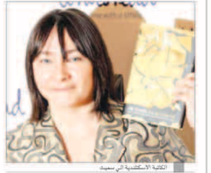
الكاتبة الاسكتلندية آلي سميت

«رويترز» : فازت رواية «كيف تكون كلاًهما» للكاتبة الإسكتلندية آلي سميت أول أمس بجائزة الرواية وهي إحدى جوائز كوستا للكتاب لعام 2014. وتتفسم الرواية إلى قسمين يبدأ كل منهما بشخصية مختلفة. وحازت الرواية على لثناء النقاد ودخلت ضمن القائمة القصيرة لجائزة مان بوكر. وتحتوي الرواية على فصتين لشخصيتين هما جورج وفرانثيسكو أحدهما مرافق في الستينات من القرن الماضي والأخرى لثان شاب في القرن الخامس عشر يعيش في مدينة فيرارا الإيطالية. ويمكن قراءة الرواية بأي من الترتيبين الزمنيين. وكانت سميت قد فازت بنفس الجائزة في 2005 عن رواية «The Accidental». وتتفانس رواية سميت مع أربعة كتب في الجائزة الرئيسية لجوائز كوستا السنوية للكتاب والتي من المقرر إعلان نتائجها في 27 يناير كانون الثاني الجاري. وفازت آليما هيلي بجائزة أول رواية عن روايتها «Elizabeth is Missing» التي ترويها سيدة سسة مصابة بالعمى.