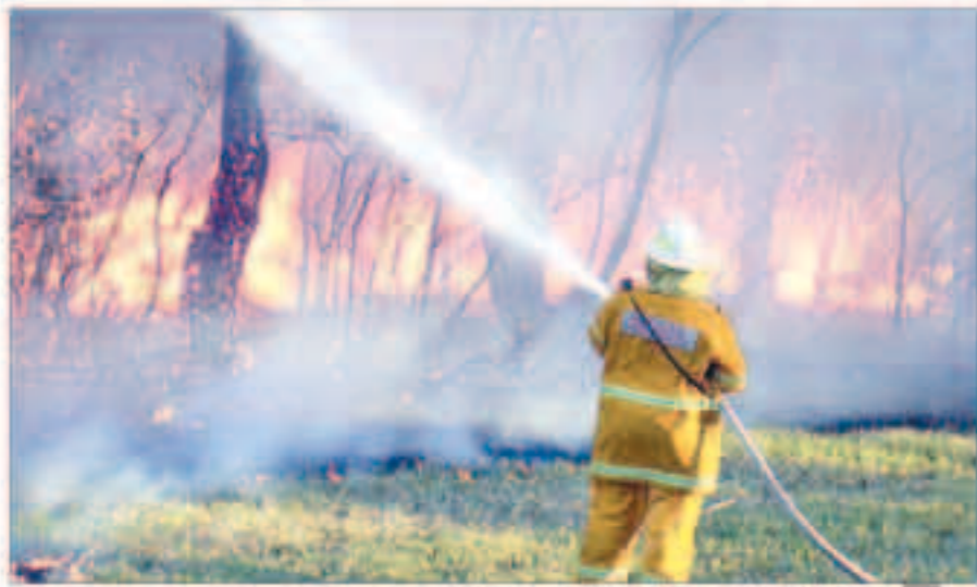
رجل إطفاء يكافح النيران المشتعلة بأحد حرائق الغابات

«رويترز» : عمل مئات من رجال الإطفاء أمس على احتواء أسوأ حرائق غابات في أستراليا منذ 30 عاماً بعدما اجتاحت بالفعل أكثر من 12 ألف هكتار خارج مدينة أديليد في الجنوب ودمرت 26 منزلاً على الأقل. تأتي الحرائق التي يبلغ نطاقها 240 كيلومتراً في ولاية جنوب أستراليا فيما أعلن المكتب الأسترالي للأرصاد الجوية أمس أن عام 2014 ثالث أدفأ عام في البلاد على الإطلاق. والشار هذا تسلاوات حول ما إذا كانت الحرائق نتيجة لتغير المناخ وعلامة على أن القادم أسوأ. وقال تيفيد كارولي استاذ علوم الغلاف الجوي في جامعة ميلبورن في بيان «ما لم تكن هناك تخفيضات سريعة وكبيرة ومستمرة لانبعاثات الغازات المسببة للاحتباس الحراري في أستراليا وعلى الصعيد العالمي فسوف تتعرض أستراليا لمزيد من موجات الحرارة وحرائق الغابات كما حدث في عام 2014». وأصيب 29 شخصاً على الأقل أو نقلوا للمستشفى لكن لم ترد أيباء عن حدوث حالات وفاة حتى الآن. وهذه أسوأ حرائق من حيث الحجم والشدة منذ حرائق أربعماء الرماد عام 1983 التي أسفرت عن مقتل 75 شخصاً ودمرت أكثر من ألفي منزل.