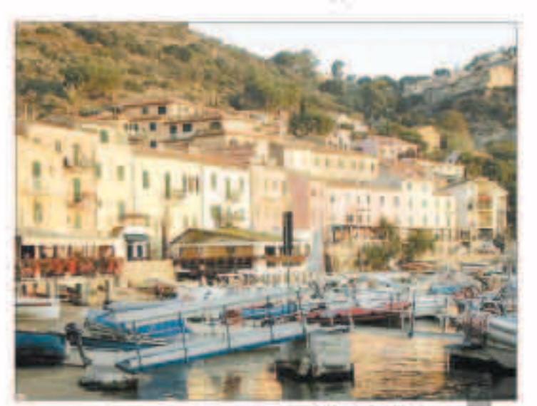
جزيرة غيلغيو في توسكانة

وسبق أن نفذت دول أوروبية مشاريع مماثلة، مثل إسبانيا وكرواتيا وفرنسا.