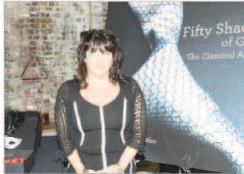
المؤلفة إي.إل. جيمس صاحبة رواية «فيفتي شادز»

«سكاي نيوز عربية»: تحققت الشرطة البريطانية في تقارير بشأن سرقة نسخة من رواية «غراي» أحدث أعمال المؤلفة إي.إل. جيمس صاحبة رواية «فيفتي شادز»، وذلك قبل اسبوع واحد من نشرها، وفقا لما ذكرته دار راندوم هاوس البريطانية للنشر، أول أمس.