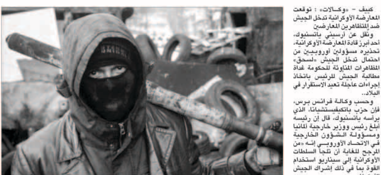
محتج خلال تظاهرات في العاصمة كيبف

وقال كيري إن رسالته التي تعارضه وتعدد دعمه لـ «التحركات الشعبية»