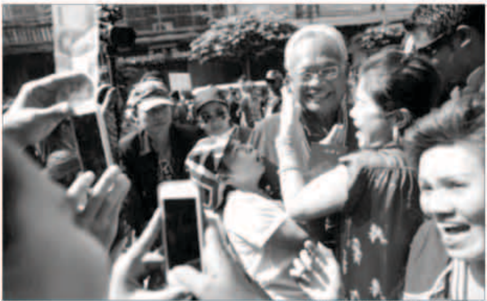
زعيم الاحتجاجات خلال تظاهرات الامس

وقال مراسل من رويترز رأى بعض المتظاهرين يحملون أسلحة وأن شخصا أصيب بعيار ناري واصيب اثنان جراء انفجارين كما سمع دوي اطلاق نار في بانكوك. ووقع الهجوم في حي لاسي في بانكوك قرب مطار دون سوانج والحي منعقل لحزب