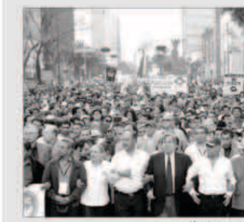
جانب من احتجاجات الامس

يعارض الإصلاحات بشدة. وينظر الكثيرون في المكسيك باعتزاز إلى طرد شركات النفط الأجنبية عام 1938 في عهد الرئيس الأسبق لازارو كارديناس. ويأمل حزب الديمقراطية الثورية في تنظيم استفتاء عام 2015 لإلغاء هذه الإجراءات.