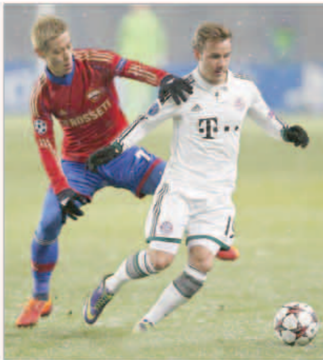
بايرن ميونخ وسسكا موسكو

الثالث لحامل اللقب في الدقيقة 65 ، البداية جاءت سريعة من خلال فريق سسكا موسكو صاحب الأرض وحقق الفريق البافاري الفوز على ضيفه سسكا موسكو الروسي بثلاثية مقابل هدف واحد في اللقاء الذي أقيم مساء أول امس على ملعب «دايتشو ستاديون» في الجولة الخامسة للمجموعة الرابعة ضمن منافسات دور الـ 32 لبطولة دوري أبطال أوروبا.