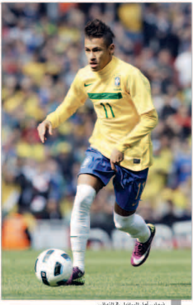
نيمار، أمل البرازيل في النهائي

أكد أندريس إنيستا نجم خط وسط المنتخب الإسباني أن منتخب البرازيل هو المرشح للفوز بنهائي كأس القارات نظرا لأن البطولة تقام على أرض واقصي السامبا. وقال إنيستا، في تصريحات لإذاعة «كوبيه» الإسبانية، «هم المرشحو للفوز نظرا لأن البطولة تقام على أرضهم ولوجود عسة الألف من الأشخاص يؤازرونهم. ينبغي أن يجعل هذا عاملا محفزا. لا يوجد تحدي أكبر من الفوز على البرازيل في ملعبها». وأشار «السامبا»: «البرازيل فريق كبير. قدم بطولة رائعة ولديه لاعبين رائعين. لدينا فريق جيد للغاية يقدم مستوى كبير يفرض النظر عن اللاعبين المشاركين في اللقاء. ليس هناك ما نبتعدنا من القول أننا سننافس على اللقب». ويرى اللاعب أن الفوز ببطولة كأس القارات سيكون له مذاق خاص، نظرا لأنه لم يسبق للمنتخب الإسباني الفوز بها.