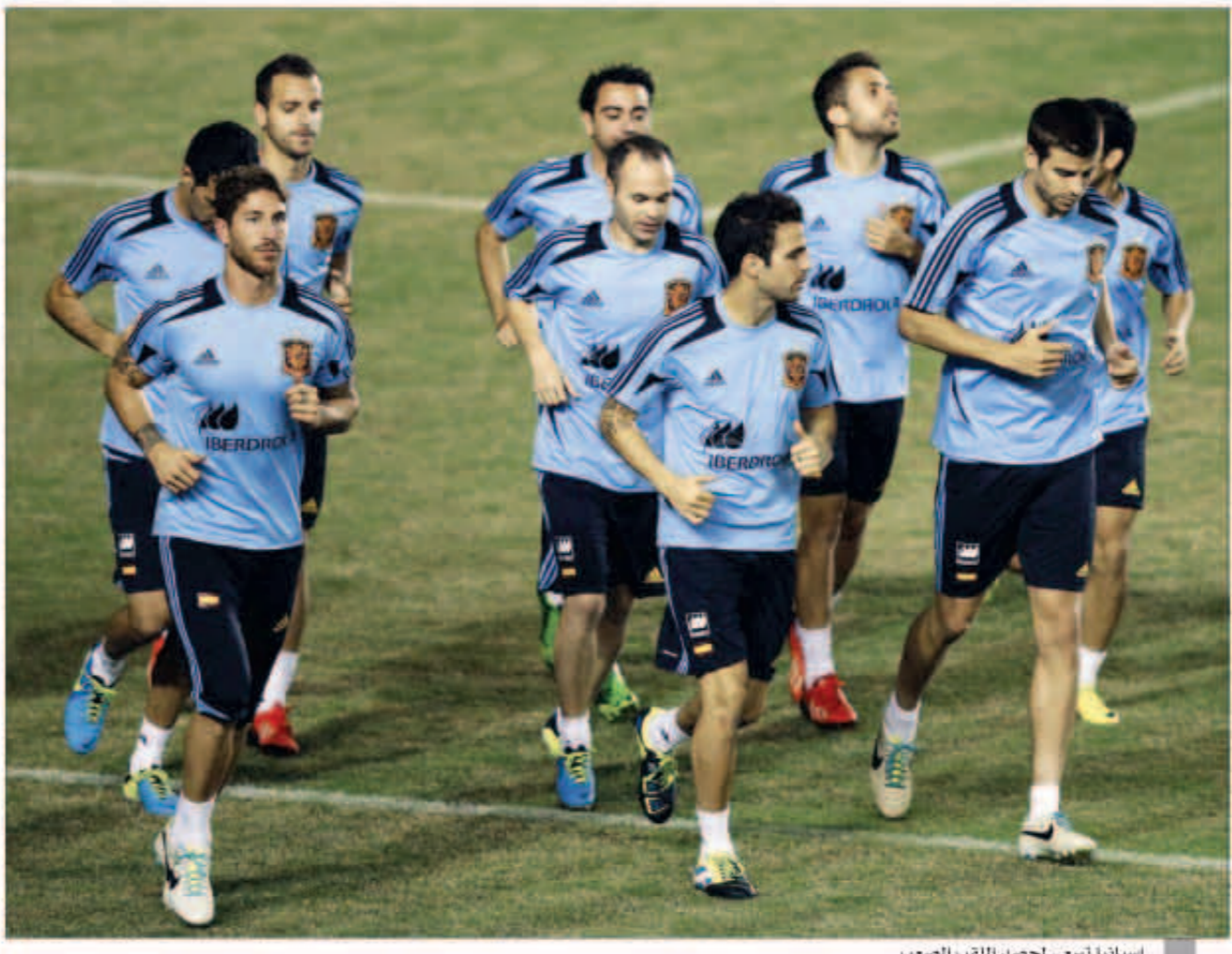
إسبانيا تسعى لحصد اللقب الصعب