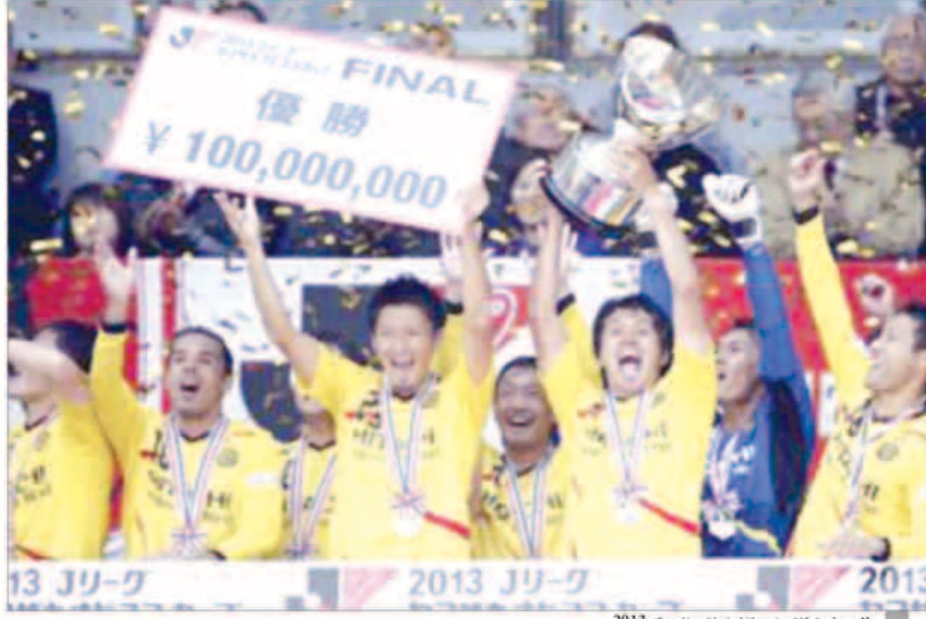
لاعبو فريق كاشيوا يحتفلون بلقب نايسكو 2013

أما عن الخاسر، فإن المدرب النمساوي ميهالو بتروفيتش «56 عاماً» أكد لكيودو بالقول: «أمر محبط للغاية، نقدم اعتذاراً للجماهير اوراوا، ولكن فقدان اللقب لا يعتبر كارثياً لأننا حاربنا بفخر في اللقاء النهائي. يذكر أن الفائز بكأس نايسكو سيلعب مع الفائز بكأس اتحاد أميركا الجنوبية «سودا أميركانا» في لقاء السوبر اللاتيني الياباني والتي تعرف باسم «كأس بنك سوروجا» وتقام سنوياً في اليابان منذ عام 2008، حيث شهد العام الماضي فوز فريق كاشيوا بـ 3-2 على فريق ساو باولو البرازيلي بنتيجة 3-2.