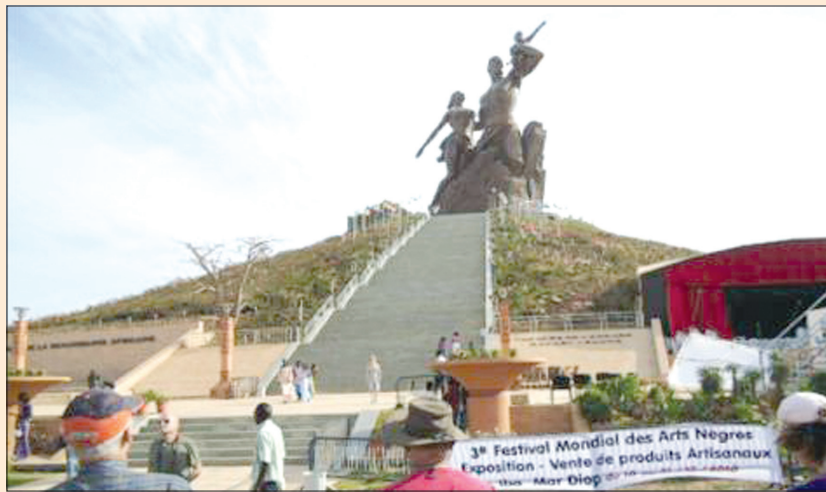
تمثال النهضة الإفريقية في دكار يعتبر أضخم تمثال في القارة