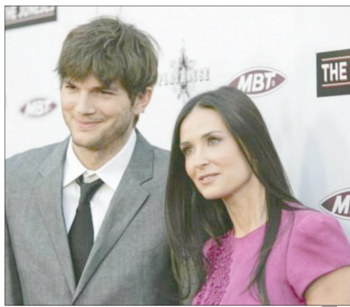
أشتون وديمي مور

لوس انجليس - «رويترز»: أنهى الممثل أشتون كوتشر وزوجته الممثلة ديمي مور إجراءات طلاقهما بعد عامين من انفصالهما لتنتهي رسمياً إحدى أبرز زيجات هوليوود.