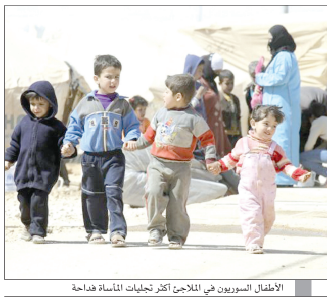
الأطفال السوريون في الملاجئ أكثر تجليات المأساة هداحة

دبي - العربية نت - بلغ عدد الولادات في مخيمات اللاجئين خلال ثلاثة أعوام من عمر الثورة السورية أكثر من 21 ألف طفل سوري، أي ما يعادل ولادة طفل لاجئ سوري كل ساعة بحسب إحصاءات للأمم المتحدة. هذا الواقع دققت على أثره الأمم المتحدة ناقوس الخطر، محذرة مما قد يؤول إليه مصير جيل جديد من السوريين في ظل أوضاع إنسانية مريرة يعانون منها داخل بلادهم وخارجها، فأكثر من مليون طفل هم من بين مليوني ومئتي ألف سوري أجبروا على ترك ديارهم والنزوح إلى دول الجوار، هرباً من القصف والقتال الدائر في سوريا، إضافة إلى خمسة ملايين آخرين حولتهم الحرب للاجئين داخل حدود بلادهم.