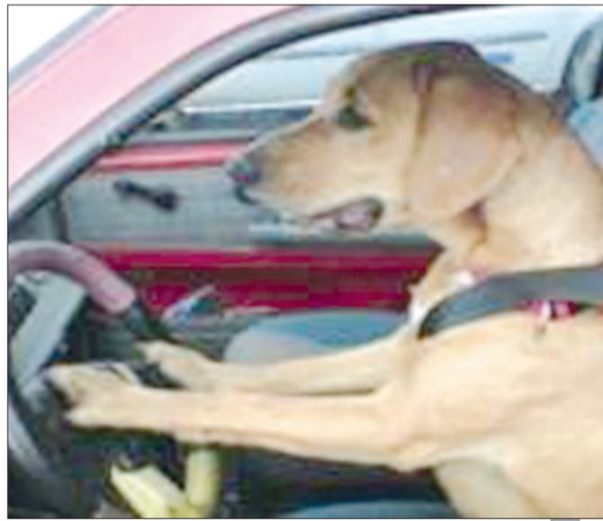
الكلب يقود سيارة