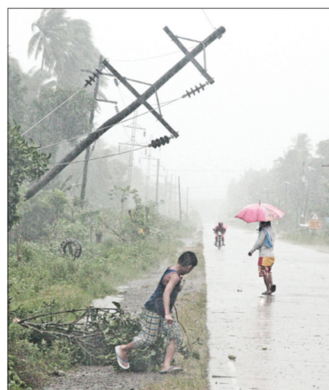
إعصار يوفيا يشرد الأهالي

مانيل «رويتز»: قال مسؤولون في الفلبين إن أقوى إعصار تشهده البلاد هذا اجتاح جزيرة مينداناو في الجنوب امس مما أسفر عن مقتل أربعة أشخاص وتدمير منازل وانقطاع خطوط الكهرباء والهاتف.