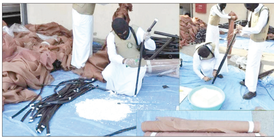
السعودية ضبطت المئات من مهربي المخدرات خلال أربعة أشهر

الرياض - «العربية نت» أعلنت وزارة الداخلية السعودية، أمس الأحد، عن تورط 278 سعوديا بتهريب مخدرات إلى المملكة بقيمة ملياري ريال.