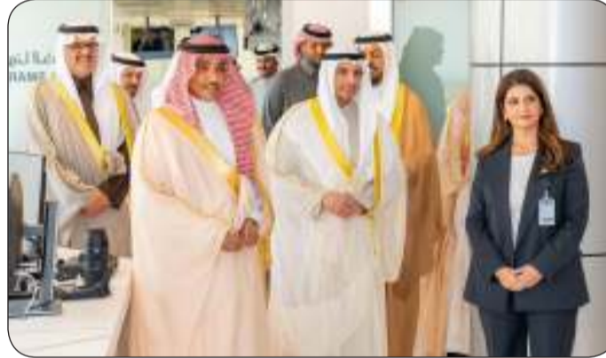
■ وزير الإعلام والثقافة وزير الإعلام السعودي خلال جولة بقطاع التحرير في كونا

طبيعة المعلومة أو الصورة. وعقب توقيع المذكرة قام الوزيران المطيري والدوسري والوفد المرافق بجولة في قاعة التحرير بمبنى «كونا» أطلعاً خلالها على آلية سير العمل والتعرف على «واحة كونا الذكية» التي تم افتتاحها مؤخراً والمتخصصة بتقنيات الذكاء الاصطناعي.