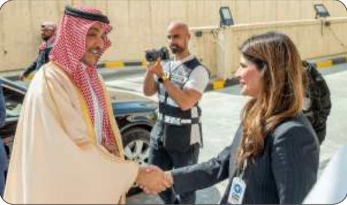
■ وزير الإعلام السعودي لدى وصوله كونا