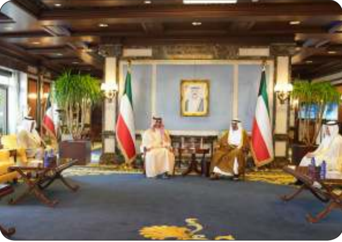
■ جانب من الاستقبال