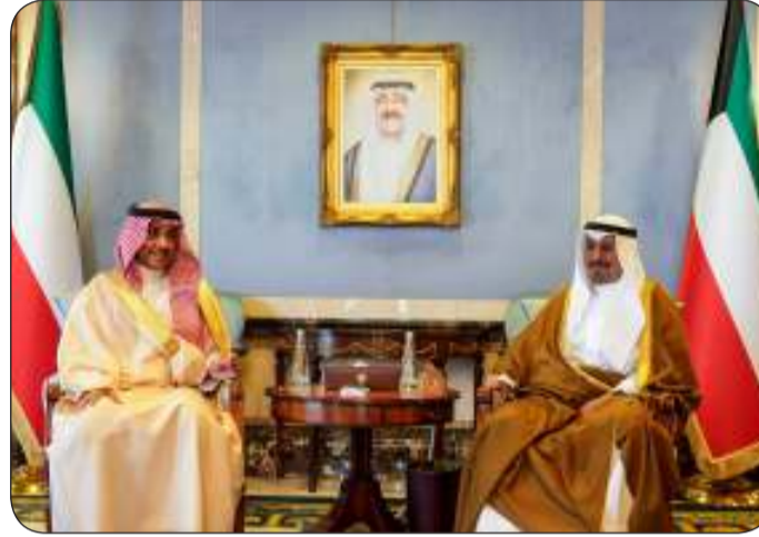
■ سمو رئيس مجلس الوزراء مستقبلاً وزير الإعلام السعودي والوفد المرافق

يوسف الدوسري والوفد المرافق له وذلك بمناسبة زيارته للبلاد. حضر المقابلة صاحب السمو الأمير سلطان بن سعد بن خالد آل سعود سفير خادم الحرمين الشريفين لدى دولة الكويت.