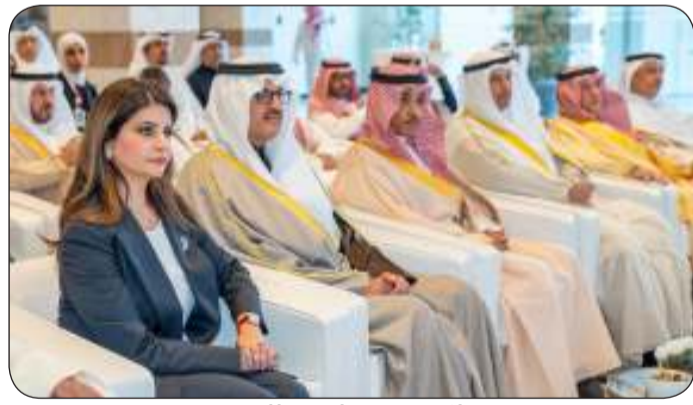
■ جانب من مراسم التوقيع

وتنص المذكرة على تبادل الأخبار والخبرات والصور بغيّة تعزيز العلاقات الإعلامية المشتركة وحفظ حقوق الطرفين ولتقديم المعلومات اللازمة لسدّ الذرائع أمام من يسعى لتشويه