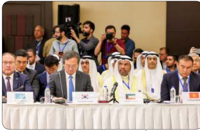
اليحيامن مؤتمرا وفد دولة الكويت المشارك في الاجتماع

ملكة تايلند الصديقة الدكتور ماريس سانجيامبونجسا أمس الإثنين على هامش أعمال الاجتماع الوزاري التاسع عشر لحوار التعاون الآسيوي الذي يعقد في العاصمة الإيرانية طهران.