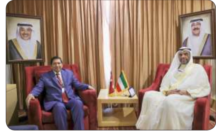
اليحيامن خلال لقائه وزير خارجية نيبال

نسبة الدبلوماسية الكويتيات في ديوان عام الوزارة وبعثاتها في الخارج بلغت 22 في المئة