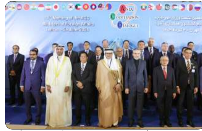
وزير الخارجية خلال مشاركته في الاجتماع الوزاري التاسع عشر لحوار التعاون الآسيوي

طهران - "كونا" - ترأس وزير الخارجية عبدالله الجحيا وفد دولة الكويت المشارك في الاجتماع الوزاري التاسع عشر لحوار التعاون الآسيوي الذي تنعقد أعماله أمس الإثنين في الجمهورية الإسلامية الإيرانية.