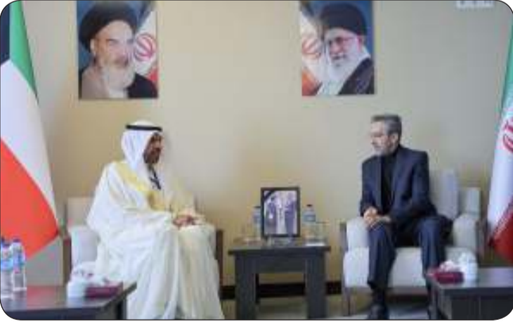
وزير الخارجية والمشرف على وزارة الخارجية الإيرانية

الإنسانية في فلسطين جراء مواصلة العدوان الإسرائيلي ووضع حد للمجازر والانتهاكات التي تنافي كل القوانين الإنسانية والقرارات الدولية مرحبا باعتماد مجلس الأمن القرار 2735 الخاص بوقف إطلاق النار الدائم في قطاع غزة وانسحاب قوات الاحتلال