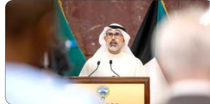
الشيخ جراح الجابر يلقي كلمته

تشكله المرأة الكويتية من عنصر أساسي في نهضة وتنمية دولة الكويت. وأعرب نائب الوزير