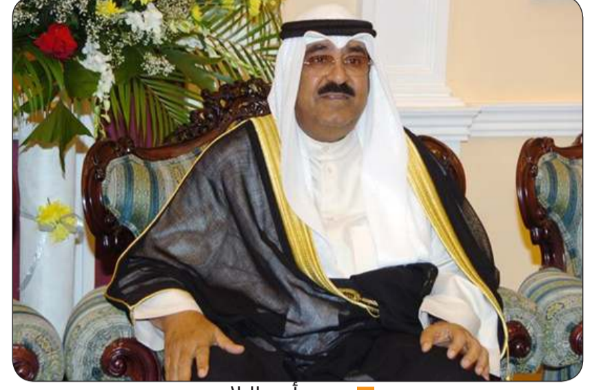
سمو أمير البلاد

بعث سمو أمير البلاد الشيخ مشعل الأحمد ببرقية تهنئة إلى أخيه صاحب السمو الشيخ تميم بن حمد آل ثاني أمير دولة قطر الشقيقة عبر فيها سموه عن خالص تهنائه بمناسبة الذكرى الحادية