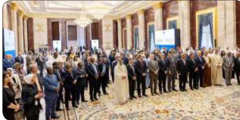
جانب من الاحتفالية

وأثبتت كفاءتها في المهام الدبلوماسية المختلفة التي كلفت بها الأمر الذي ساهم في تحقيق مصالح دولة الكويت وتعزيز مكانتها المرموقة على الصعيدين الإقليمي والدولي. وأضاف أن نسبة الدبلوماسيات الكويتيات في ديوان عام وزارة الخارجية وبعثاتها في الخارج بلغت 22 في المئة من إجمالي عدد منتسبي السلك الدبلوماسي الكويتي الأمر الذي يعكس حرص الوزارة على مساندة ودعم المرأة وتمكينها.