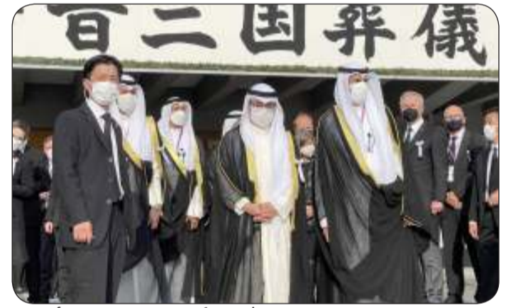
وزير الخارجية حضر مراسم تشييع رئيس وزراء اليابان الأسبق

الأسبق شينزو آبي. وجدد الناصر خالص التعازي بوفاء رئيس وزراء اليابان الأسبق شينزو آبي، مستذكرا مسيرته الحافلة بالعبء وإسهاماته الكبيرة في إطار تعزيز العلاقات الكويتية - اليابانية. كما تم خلال اللقاء بحث العلاقات الثنائية الوثيقة التي تربط البلدين الصديقين وسبل تطويرها وتنميتها في مختلف المجالات بالإضافة إلى مناقشة آخر المستجدات على الساحتين الإقليمية والدولية.