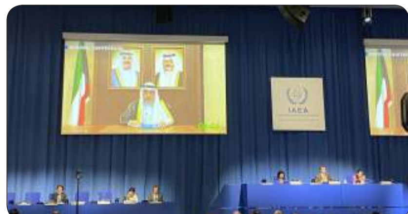
الناصر متحدثا في المؤتمر عبر الاتصال المرئي

ودعا الجمهورية الإسلامية الإيرانية للتعاون التام مع الوكالة الدولية للطاقة الذرية لتوضيح وتسوية المسائل التي لم تزل عالقة منذ أمد، مجددا تأكيد البلاد على حق جميع الدول باتنتاج وتطوير واستخدام الطاقة النووية للأغراض السلمية في إطار ما نصت عليه معاهدة عدم انتشار الأسلحة النووية إلا أنها تحذر من أن خطر انتشار الأسلحة النووية وباقى أسلحة الدمار الشامل يشكل تحديا للسلام والأمن الدوليين وللذان باتنا على المحك في ظل التحديات والتوترات والأحداث والممارسات التي يشهدها عالمنا اليوم.