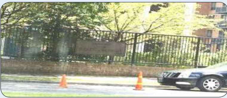
سفارتنا في واشنطن

دعت سفارتنا لدى الولايات المتحدة الأمريكية المواطنين الكرام المتواجدين في المناطق المتوقع أن تتعرض لإعصار «إيان» الذي سيضرب بعض المناطق الأمريكية إلى أنه قد تم تخصيص فندق في مدينة ميامي في ولاية فلوريدا وفندق كموقعين لإجلاء المواطنين الكويتيين الذين يرغبون في ذلك وعلى النحو التالي: 1. الفندق في مدينة ميامي: HILTON MIAMI DADELAND N Kendall Dr. 9100 Miami, FL 33176 التفون: +17869751920 2. الفندق في مدينة أتلانتا: THE OMNI HOTEL CNN CENTER CNN CENTER 100 NW, ATLANTA, GA 30303 التفون: +14046590000 كما تم تحديد موقع في مدينة تامبا في ولاية فلوريدا للنقل للمواطنين إلى هاتين المدينتين عبر حافلات مخصصة لذلك يشهدها عالمنا اليوم. حيث ستتحرك هذه الحافلات في تمام الساعة 12:00 ظهرا من اليوم الثلاثاء الموافق 27/9/2022 من العنوان التالي: E HILLSBOROUGH 1720 AVE, TAMPA, FL 33610 وتؤكد السفارة في واشنطن للمواطنين الكويتيين الكرام ضرورة أخذ الحيطة والحذر واتخاذ التدابير اللازمة للتعامل مع هذا الإعصار متمنية للجميع السلامة كما انها وفي الوقت الذي تتمنى السفارة للجميع السلامة فإنها تؤكد ضرورة اتباع التوجيهات الصادرة من السلطات المحلية المعنية. وفي هذا الصدد تحث السفارة مواطنيها على الاستمرار بالتواصل معها على الأرقام التالية: - سفارة دولة الكويت 2022620758 - القنصلية العامة في نيويورك 9172426688 - رقم الطوارئ لمدينة ميامي 2028733671 - رقم الطوارئ لمدينة أتلانتا 9172974449 / 2106665555