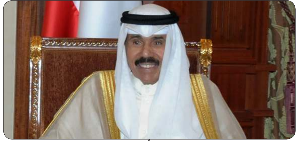
سمو أمير البلاد

بعث سمو أمير البلاد الشيخ نواف الأحمد ببرقية تهنئة إلى الرئيس سيردار بيردي محمدوف رئيس جمهورية تركمنستان الصديقة عبر فيها سموه عن خالص تهانيه بمناسبة العيد الوطني لبلاده، متمنيا سموه له موفور الصحة والعافية ولجمهورية تركمنستان وشعبها الصديق كل التقدم والازدهار. وبعث سمو ولي العهد الشيخ مشعل الأحمد، وسمو الشيخ أحمد النواف رئيس مجلس الوزراء ببرقيتي تهنئة مماثلتين.