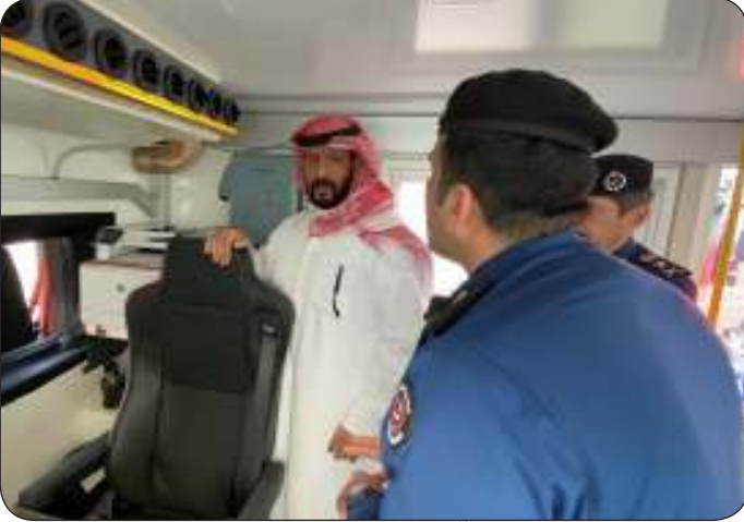
الخالد داخل الآليات الجديدة التي تم تدشينها