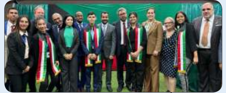
أعضاء سفارة دولة الكويت لدى فنزويلا

كراكاس - "كونا": أعلنت سفارة دولة الكويت لدى فنزويلا أن الجناح التابع لها فاز بالعلامة التامة في المهرجان الجامعي التاسع عشر للبعثات الدبلوماسية والتجارية المعتمدة الذي أقيم في جامعة "سانتا ماريا" بالعاصمة كراكاس. وذكرت السفارة في بيان لـ "كونا" أنه شارك في المهرجان أكثر من 50 بعثة دبلوماسية معتمدة في فنزويلا وذلك بهدف دعم الطلبة الجامعيين في اختصاص الدراسات الدولية. وأفادت بأن جناح دولة الكويت في هذا المهرجان حقق على أعلى درجة تقييم وذلك بفضل دعم ومشاركة السفارة حيث تم تزويده بالمواد الإعلامية والمشغولات