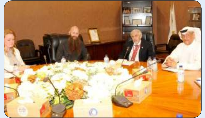
هوليبستايدر خلال اجتماعه بمجلس إدارة «الهلال الأحمر»

ولفت إلى دور الجمعية في مساعدة الأسر المحتاجة والمتفككة داخل الكويت من الناحية الإغاثية والصحية والتعليمية مشيدا بالاهتمام الكبير الذي توليه لمشاريعها الإنسانية عبر توفير جميع مستلزمات الحياة للمحتاجين في دول العالم. من جانبه أعرب السائر في تصريح مماثل عن سعادته بزيارة القائم بالأعمال الأمريكي والوفد المرافق له للاطلاع على نشاط وإنجازات الهلال الأحمر الكويتي لافتا إلى أن ذلك يمثل