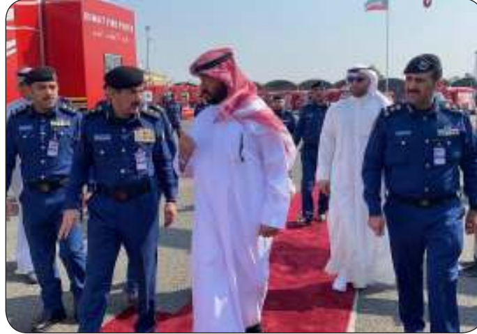
الشيخ طلال الخالد والفريق خالد المكراد خلال التدشين

المساعدة بعمليات مكافحة الحرائق والإنقاذ. وأضافت أن معظم الآليات مزودة بأحدث أنظمة الاتصالات والملاحقة ولها القدرة على مكافحة الحرائق بكفاءة عالية مما يقلل في الجهد والوقت المستغرق ويساهم بتقليل الخسائر والأضرار. وذكرت أن الشيخ طلال الخالد أشاد بما تقوم به قوة الإطفاء العام للحفاظ على الأرواح والممتلكات لتحقيق الأمن المجتمعي إضافة أن هذه الآليات وسيلة لمساعدة رجال الإطفاء على أداء مهامهم الجسيمة المناطة فيهم.