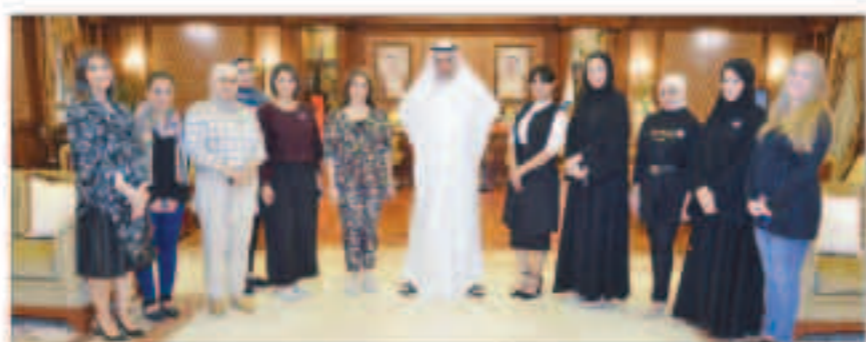
الشيخ فيصل الحمود مستقلاً عبداً من المشاركات في الحلقة النقاشية

أكد محافظ القروانية الشيخ فيصل الحمود المالك الصباح، أن الشباب هم عدة الحضار وأمل المستقبل ومن ثم إن استثمار إمكاناتهم المتنوعة على الوجه الأمثل، يعد شكلاً من أشكال التنمية المستدامة في حياة الشعوب والأمم التي تبحث عن التطور والرفي من خلال خلق أجيال شبابية قادرة على تحمل المسؤوليات الوطنية. وأضاف في كلمته خلال رعايته وحضوره الحلقة النقاشية الشبابية التي أقيمتها محافظة القروانية وبالتنسيق والشراكة مع الهيئة العامة للشباب، لتعريفهم ببيدات وأهداف المجلس الشبابي، تمهيداً لإطلاقه، أن توجيهات القيادة السياسية في البلاد إلى دعم الشباب واحتضان الطاقات المبدعة والحث على وضعهم بمواقع اتخاذ القرار وتحمل المسؤولية يجعلهم بؤرة اهتمام الدولة ومستقبلها الواعد. وذكر أن بلدنا العزيز الكويت يزخر بالعديد من التجارب الشبابية الناجحة في جميع المجالات مما يحثهم علينا كمسؤولين ومسائرتهم ودعمهم، انطلاقاً من اهتمام القيادة السياسية في البلاد بطاقات الشباب والتي تقدم لهم كل الدعم والمساندة مالياً ومعنوية، إيماناً منهم بأن الكويت يجب أن تبني بسواعد أبنائها الشباب الذين حملوا مشاعل التقدم والتنمية الحقيقية.