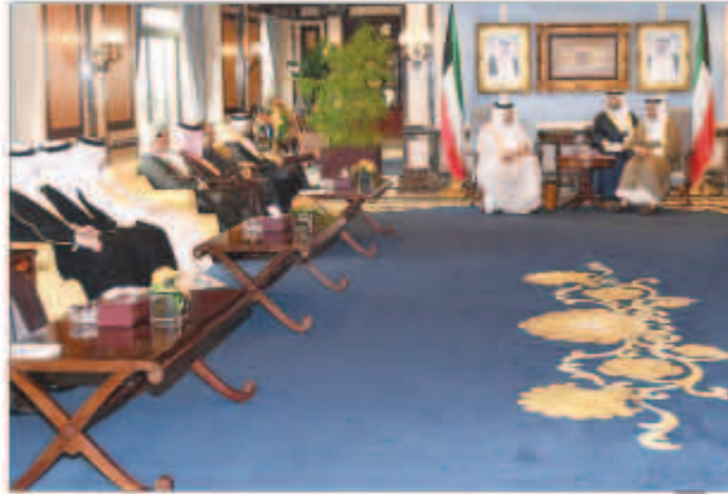
سموه مستقلاً الزباني ووزراء بلديات الخليج

الدكتور ياسل الصباح ورئيس ديوان رئيس مجلس الوزراء الشيخة اعتماد الخالد وسفير الكويت لدى أوكرانيا الدكتور راشد حماد العدواني. كما استقبل المبارك وبحضور نائب رئيس مجلس الوزراء ووزير الخارجية الشيخ صباح الخالد - رئيس مجموعة الصداقة البرلمانية (البريطانية - الكويتية) في مجلس العموم البريطاني ليو دوكرتي والوفد المرافق له وذلك بمناسبة زيارته للبلاد.