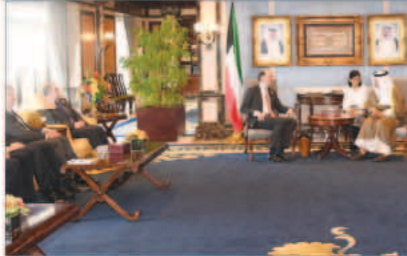
سموه مستقلاً وفد الصداقة الكويتية البريطانية

استقبل سمو الشيخ جابر المبارك رئيس مجلس الوزراء وبحضور نائب رئيس مجلس الوزراء ووزير الخارجية الشيخ صباح الخالد في قصر السيف أمس رئيس مجلس الشورى في المملكة العربية السعودية الشيخة عبدالملك بن محمد إبراهيم آل شيخ والوفد المرافق له وذلك بمناسبة زيارته للبلاد. حضر المقابلة رئيس بعثة الشرف المرافقة النائب الدكتور عودة عودة