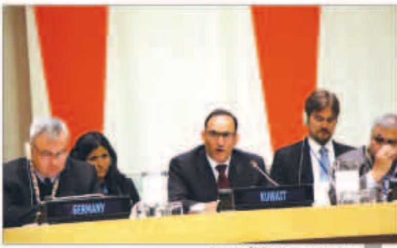
مندوب الكويت الدائم في الأمم المتحدة

والسولي وعانقا اسام تحقيق التنمية المستدامة. وتابع العتيبي قائلاً «إن هذا يعد من أهم المحركات المالية في العالم وفي العراق شهدنا تحفيف قوات نظام صدام حسين للأهواز ما بين شهري الفرات والديجلة في أوائل التسعينيات وهو أكبر نظام بيولوجي للأراضي الرطبة في الشرق الأوسط مما أدى إلى تقليص حجمها إلى أقل من نسبة 10 في المئة من نطاقها الأصلي وتحولها إلى صحراء قاحلة ذات قشور ملح». وأوضح أنه في أجزاء أخرى من العالم مثل أفغانستان وكولومبيا أدت عقود من الحروب إلى خسارة هائلة في الموارد الطبيعية فيما شهدت دول أخرى أيضاً فقدان التنوع البيولوجي المهم بما في ذلك جمهورية الكونغو الديمقراطية وجنوب السودان.