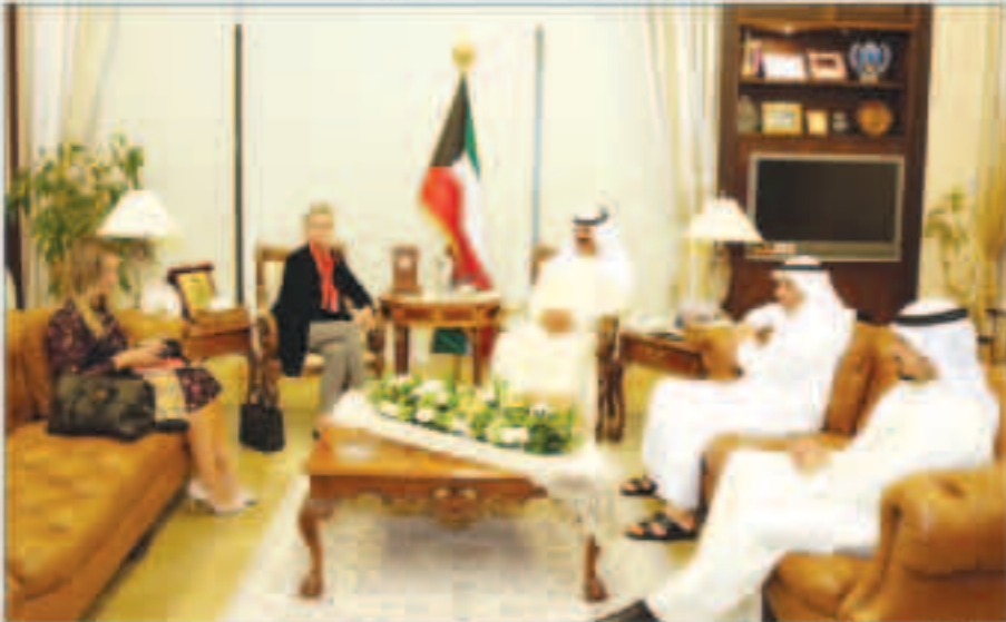
... ومستقلاً وولبول

التقى نائب وزير الخارجية خالد الجارالله أمس سفير الولايات المتحدة الأمريكية لدى دولة الكويت لورانس سيلفرمان وتم خلال اللقاء بحث عدد من أوجه العلاقات الثنائية بين البلدين إضافة إلى تطورات الأوضاع على الساحتين الإقليمية والدولية. واجتمع الجارالله في وقت لاحق مع نائب الممثل الخاص للأمين العام للأمم المتحدة في العراق المعنية بالشؤون السياسية والمساعدة الانتخابية اليس وولبول التي تقوم بزيارة للبلاد.