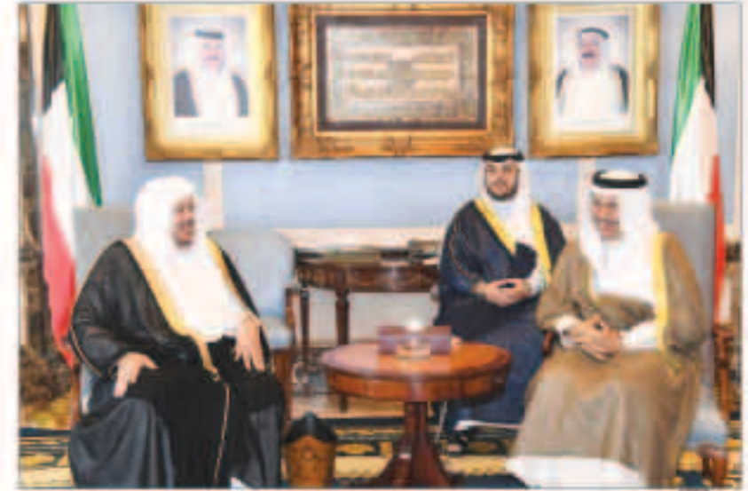
سموه رئيس الوزراء مستقلاً رئيس مجلس الشورى السعودي

وذلك بمناسبة انعقاد اجتماعهم الحادي والعشرين في الكويت. حضر المقابلة رئيس ديوان رئيس مجلس الوزراء الشيخة اعتماد خالد الأحمدي الصباح. واستقبل المبارك وبحضور وزير التجارة والصناعة خالد ناصر الروضان نائب رئيس مجلس الوزراء بجمهورية أوكرانيا الصديفة باولو روزينكو والوفد المرافق له وذلك بمناسبة زيارته للبلاد. حضر المقابلة وزير الصحة الشيخ