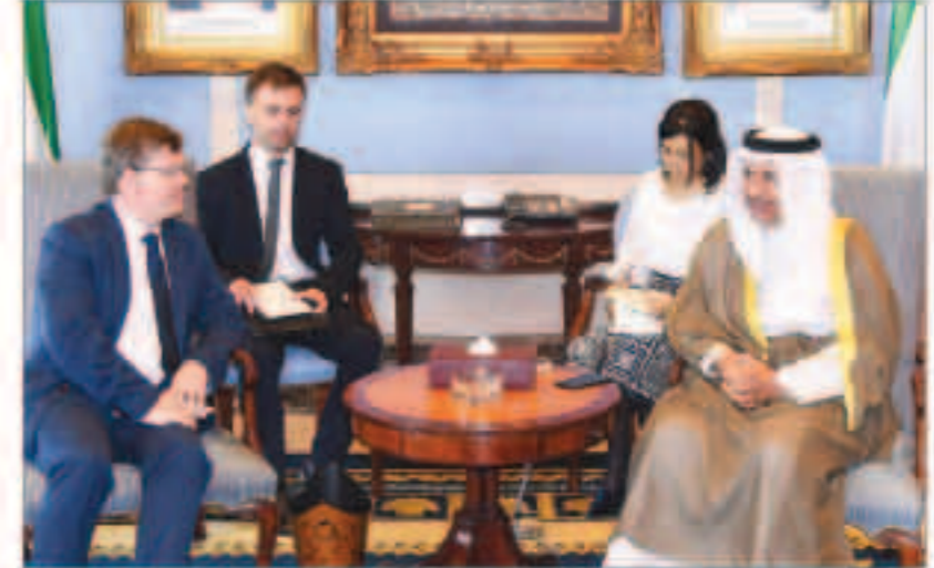
المبارك مستقلاً نائب رئيس وزراء أوكرانيا