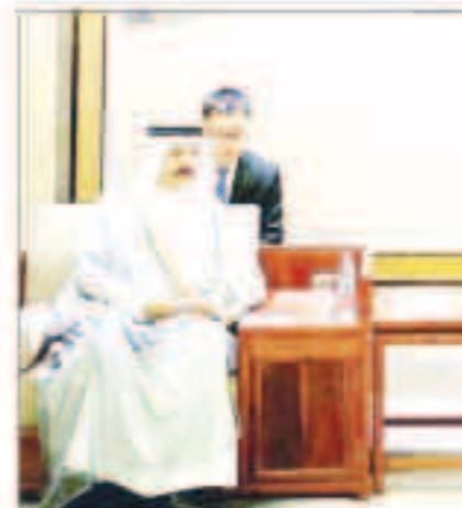
فونغ قائم مع حيات

بكين - "كونا" : أكد مسؤول صيني أمس حرص بلاده على تعزيز العلاقات التاريخية الاستراتيجية القائمة بين الصين والكويت في إطار تنفيذ توجيهات سمو أمير البلاد الشيخ صباح الأحمد والرئيس الصيني شي جين بينغ. جاء ذلك خلال اجتماع الأمين العام للجنة البلدية المركزية للحزب الشيوعي الصيني الحاكم في مدينة (تايبان) بمحاضرة (شوندونغ) تسوي فونغ قائم مع سفير الكويت لدى الصين سمح حيات على هامش مشاركته في منتدى التعاون الاستراتيجي الدولي والفتاح مهرجان مسابقة نسق جبل (تشانان) الدولي الدورة الـ 33 في (تايبان) بدعوة من الحكومة الصينية. وقال فونغ قائم ان لمة إمكانات هائلة لتطوير العلاقات الاستراتيجية التاريخية القائمة بين البلدين مشيراً إلى ان الرئيس الصيني وسمو أمير البلاد التقياً عدة مرات ورسم خارطة الطريق لتطوير العلاقات الثنائية والنهوض بها. ودعا إلى ضرورة الإسراع في تنفيذ التوافق الذي توصلت إليه قيادات البلدين وتعميق الثقة السياسية المتبادلة وتعزيز أوجه