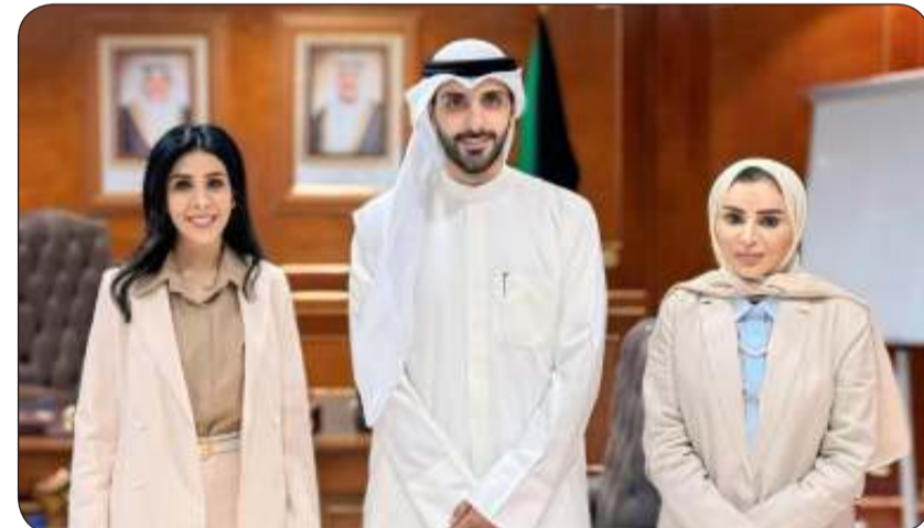
الحويولة والمشعان مع رئيس اتحاد الجمعيات التعاونية

إدارة اتحاد الجمعيات التعاونية مصعب الملا الذي أكد استعداد الاتحاد لتنظيم فرق تطوعية للمشاركة في المناطق السكنية لخدمة أهالي المنطقة حيث أشادت الوزيرة المشعان بهذه المبادرة "القيمة لخدمة أهالي المنطقة خاصة وجميع مناطق الكويت عامة". وأكدت الوزيرة المشعان أنه يمكن لهذه الفرق توفير فرصة للفرق التطوعية للتعاون والعمل المشترك من أجل تحسين المحيط السكني بالتعاون مع وزارة البلدية والجهات ذات الصلة تعزيزاً للمسؤولية المجتمعية والتعاون بين أفراد.