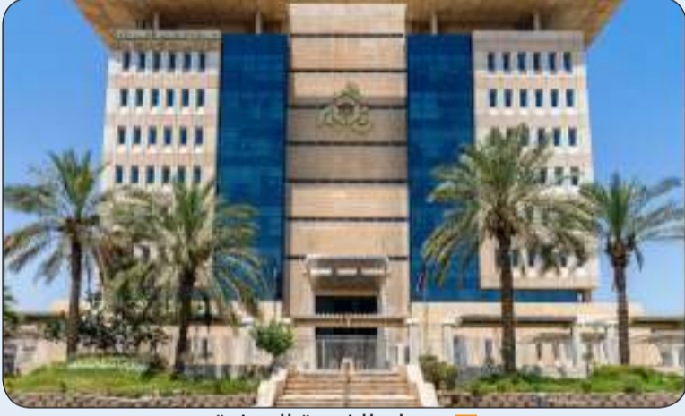
ديوان الخدمة المدنية

المؤهل الدراسي على الموقع الإلكتروني للديوان وستتم المعادلة لاحقاً. وأوضح أنه بمجرد الدخول على الموقع الإلكتروني الرسمي للديوان وإدخال البيانات الأساسية يضمن التسجيل في الفترة "87" على أن يتم تحميل المؤهل الدراسي والمعادلة في وقت لاحق بعد نهاية فترة التسجيل إلى حين اعتمادها من الجهات المختصة.