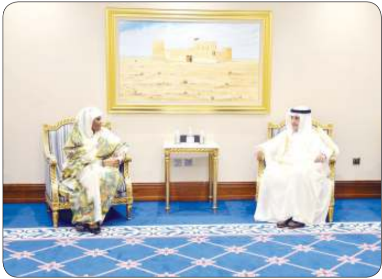
■ .. ووزيرة الخارجية السودانية