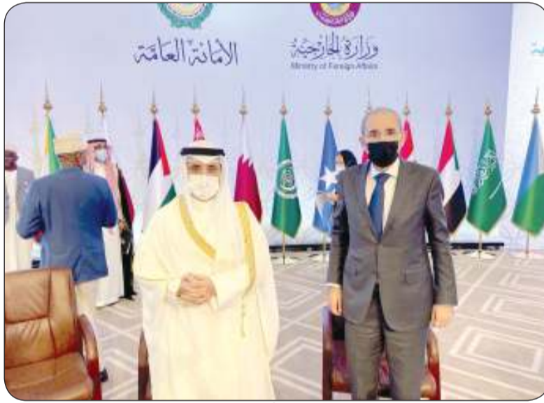
■ .. والأردني