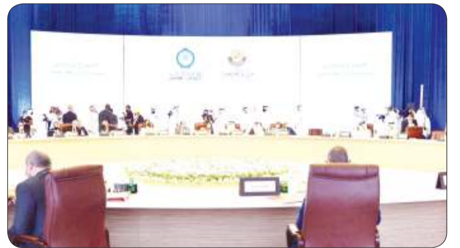
■ الاجتماع التشاوري لوزراء الخارجية العرب