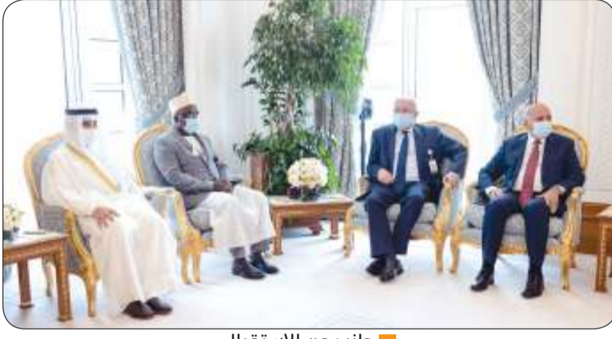
■ جانب من الاستقبال

خارجية جمهورية السودان الشقيقة مريم الصادق وذلك على هامش أعمال الاجتماع. وتم خلال اللقاء مناقشة مجمل المواضيع المتصلة بالعلاقات الثنائية بين البلدين الشقيقين وبحث القضايا العربية والإقليمية والدولية ذات الاهتمام المشترك. كما التقى الناصر مع نائب رئيس مجلس الوزراء وزير الدفاع الوطني ووزيرة الخارجية والمغتربين بالوكالة في الجمهورية اللبنانية الشقيقة زينة عكر وذلك على هامش أعمال الاجتماع التشاوري. وتم خلال اللقاء مناقشة مجمل المواضيع المتصلة بالعلاقات الثنائية بين البلدين الشقيقين وبحث القضايا العربية والإقليمية والدولية ذات الاهتمام المشترك.