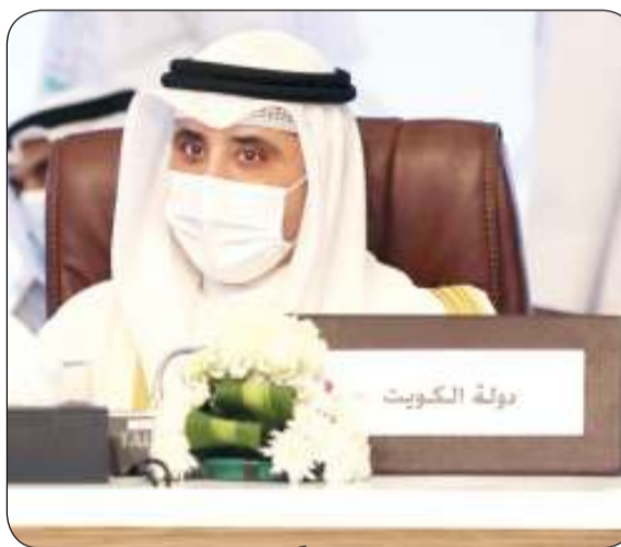
■ الناصر مترئسا وفد الكويت