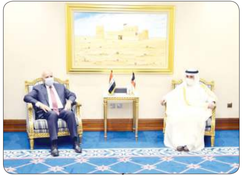
■ الناصر ملتقياً نظيره العراقي

بمناسبة مرور 19 عاما على إنشاء المنظمة نائب وزير الخارجية شارك باحتفالية الأمانة العامة لحوار التعاون الآسيوي