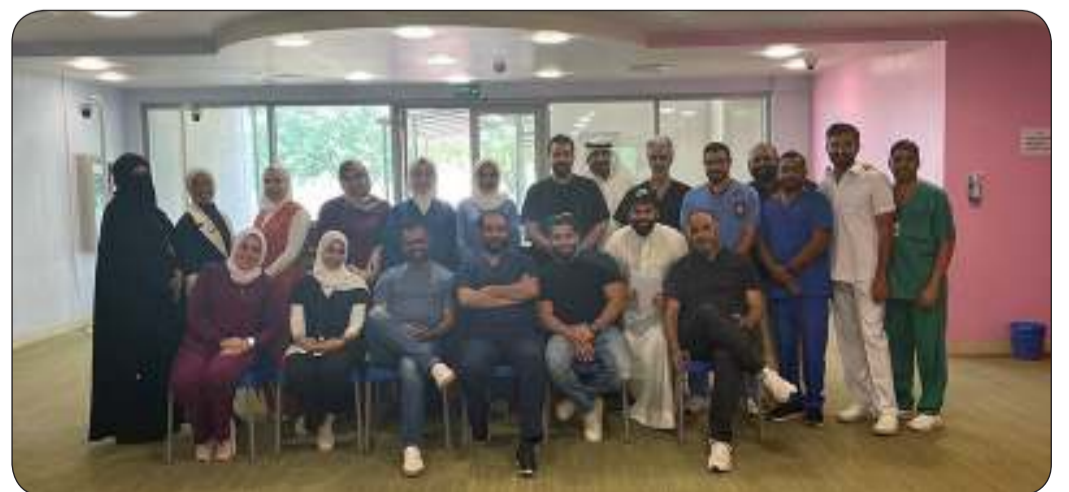
احتفال العاملين في المحجر بالمناسبة

أغلقت وزارة الصحة محجر جابر الواقع في مستشفى جابر الأحمد، وذلك بعد استقرار الوضع الوبائي وانحسار