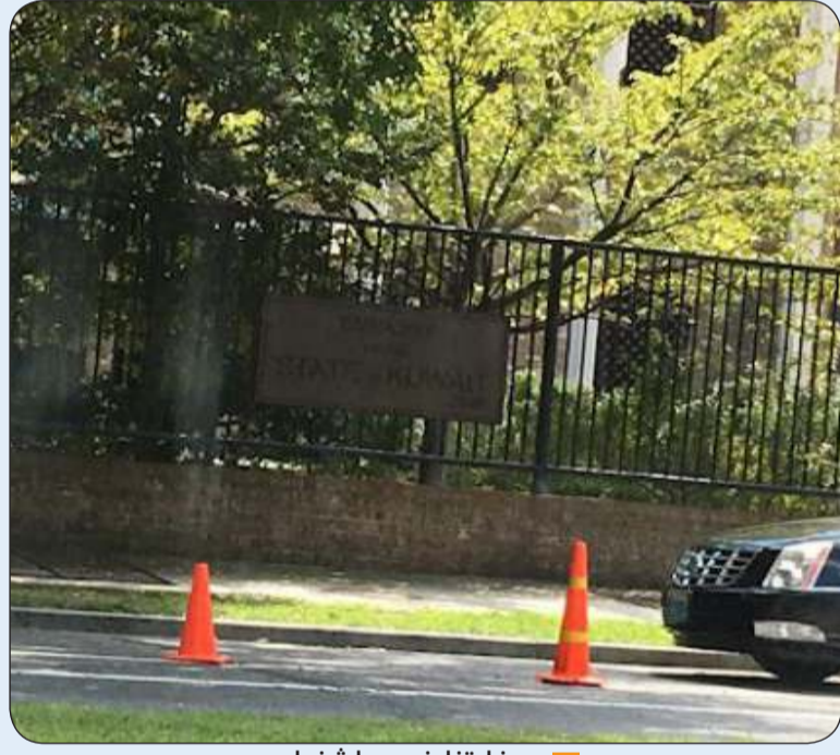
سفارتنا في واشنطن

واشنطن - "كونا": حذرت سفارة دولة الكويت في الولايات المتحدة الأمريكية من قيام جهات مشبوهة بالإدعاء بأنها تمثل القسم القنصلي في سفارة الكويت في واشنطن مشيرة إلى أن هذه الجهات تتطلب من بعض المواطنين دفع مبالغ مالية نظير خدمات قنصلية أو أكاديمية كتسجيل الطلبة في الجامعات الأمريكية أو تصديق الشهادات وغيرها. وأكدت السفارة في بيان تلقت لـ "كونا" نسخة منه أنها لا تقوم بالتواصل مع المواطنين الكرام سواء عن طريق الإتصال أو الرسائل الإلكترونية لطلب مبالغ مالية بأي شكل من الأشكال. وناشدت السفارة إلى عدم التجاوب مع هذه الاتصالات والرسائل وعدم دفع مبالغ أو المشاركة بأي معلومات أو أوراق رسمية كصور جوازات السفر وصور البطاقات المدنية وشهادات أكاديمية أو أية إثباتات شخصية أخرى داعية إلى ضرورة إبلاغ الشؤون القنصلية في وزارة خارجية دولة الكويت في حال تلقيهم مثل هذه الاتصالات والتواصل مع السفارة في واشنطن على هاتف الطوارئ +12022620758. وأكدت السفارة على أنها تحتفظ بحقها في إتخاذ الإجراءات القانونية المناسبة ضد أية جهات أو أفراد ممن يدعون أنهم من منتسبي السفارة أو يمثلونها دون وجه حق.