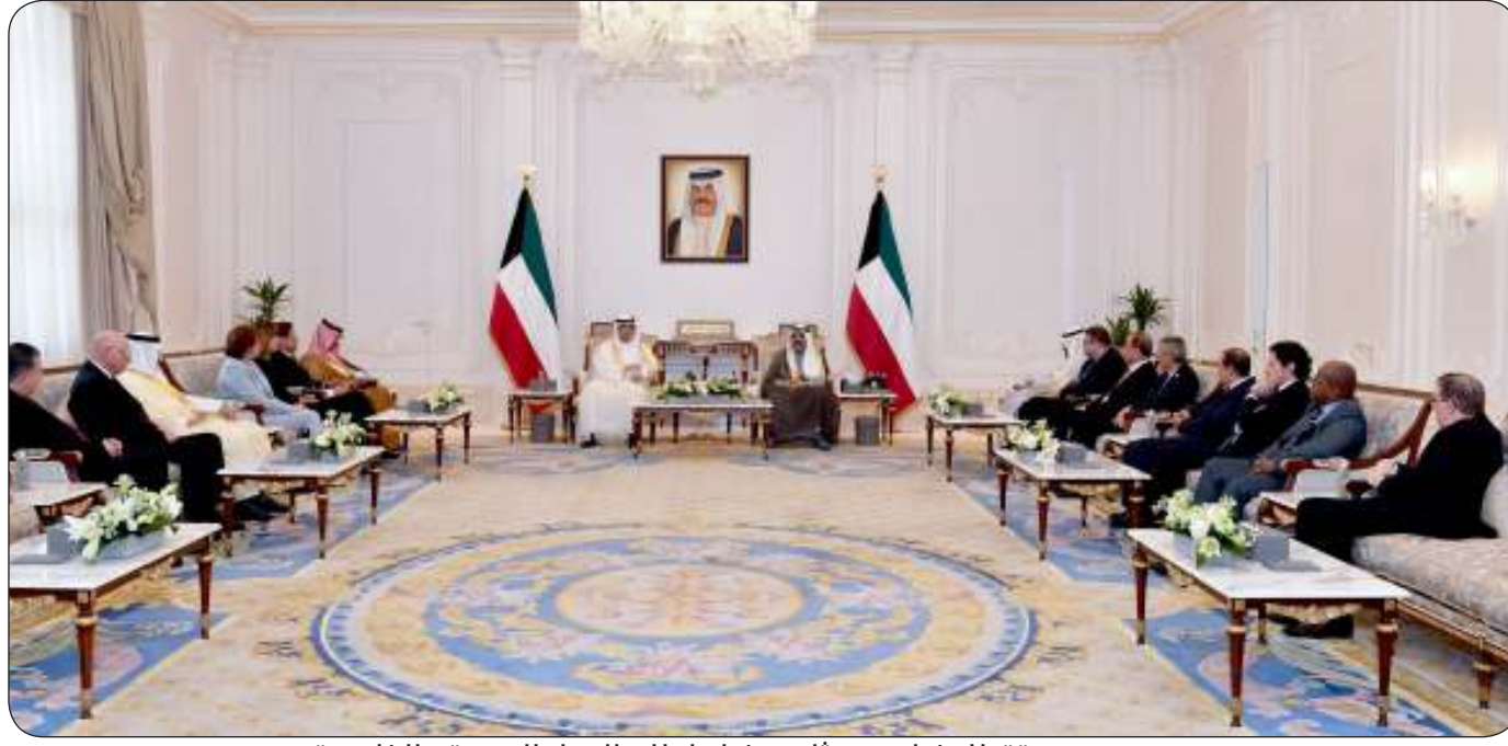
سموه مستقبلاً وزراء وممثلي وزراء إعلام الدول العربية والخليجية

الارتقاء بالإعلام العربي بجميع مجالاته وتطوير العمل المشترك إقليمياً ودولياً